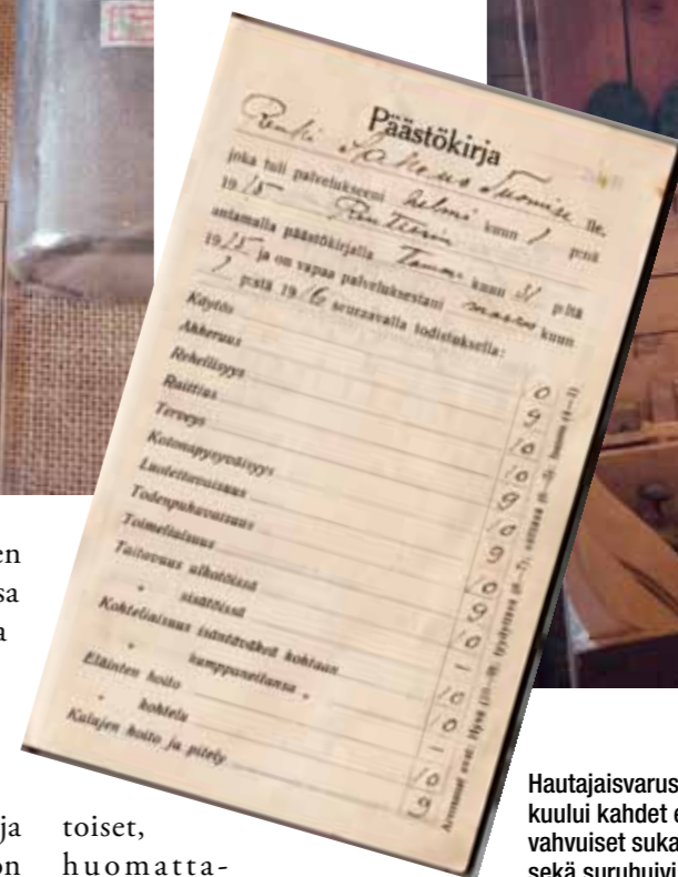
”Työtodistus” vuodelta 1915.