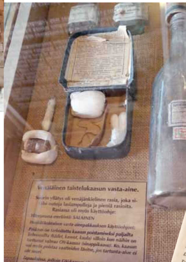
Näyttelyn ehkä erikoisin esine oli venäläinen taistelukaasujen torjuntaan tarkoitettu ensiapupakkaus.

Yksi vanha puuarkku oli vuorattu kauniisti vanhan sarjakuvan sivuilla. Tarkemmin asiaa tutkailtua löytyi kyseinen sarjakuva netistä. Buster Brown -sarjakuva oli ollut valtavan suosittu hahmo Yhdysvalloissa