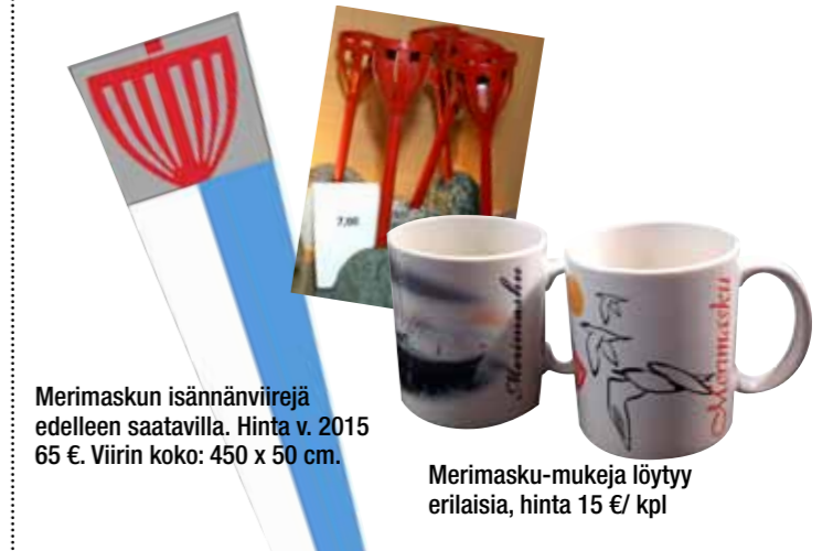
Merimaskun isännänviirejä edelleen saatavilla. Hinta v. 2015 65 €. Viirin koko: 450 x 50 cm.

Merimaskussa -lehtiä, Kollola-kirjoja, vanhoja karttoja, sekä Merimaskun reimari -matkamuistoja. ☘