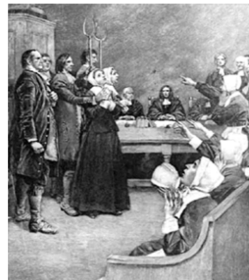
Piirros noitaoikeudenkäynnistä Yhdysvalloista Salemin kaupungissa 1692. Kuvassa todistajat osoittavat syytetyjen yläpuolella olevan paholaisen estämässä tunnustuksia.

Kirkkoherrat ja huolestuneet vanhemmat järjestävät valvojaisia, joissa lapsia pidetään hereillä, jotta noidat eivät yöaikaan veisi heitä Bläkullaan. Valvojaisten aikana rukoillaan ja luetaan raamattua. Samalla kuitenkin kuullaan myös tarinoita Bläkullasta. Hyvästä