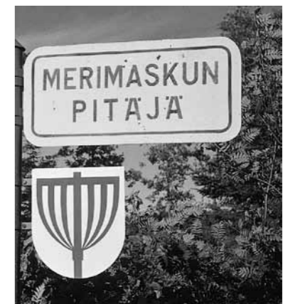
Kaikissa yhteyksissä ei vaakunan reimari tai vaakunakilpi ole noudatettavat hyväksytyt muotoja