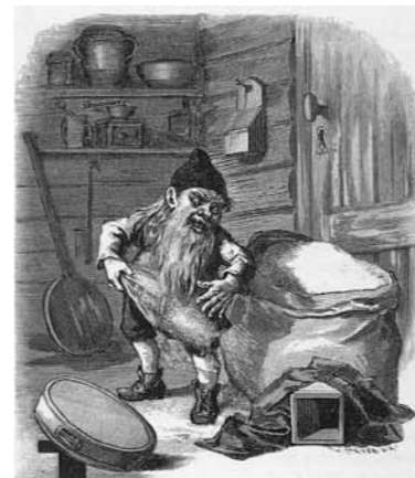
Kotitonttua on kohdeltu väärin ja se kostaa heittelemällä viljat säkistä lattialle.

Kodinhaltian uskottiin näyttävän milloin asuinrakennuksessa tai pihamaalla, milloin taas riidessä, navetassa, tallissa tai saunassa, tai myllyssä. Haltian tehtävä oli suojella taloa, sen vuoksi eivät aikuiset sitä pelänneet. Haltian näyttävä-