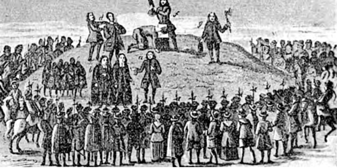
Julkinen mestaus oli paitsi rangaistus syytetyille, myös pelotukseksi muille kansalaisille. Pelottavuudestaan huolimatta mestaukset ja rangaistukset keräsivät yleisöä.

kreivi Magnus De la Gardie ja kreivi Per Brahe ovat keuhkolla 1669 huolissaan hysterian leviämisestä.