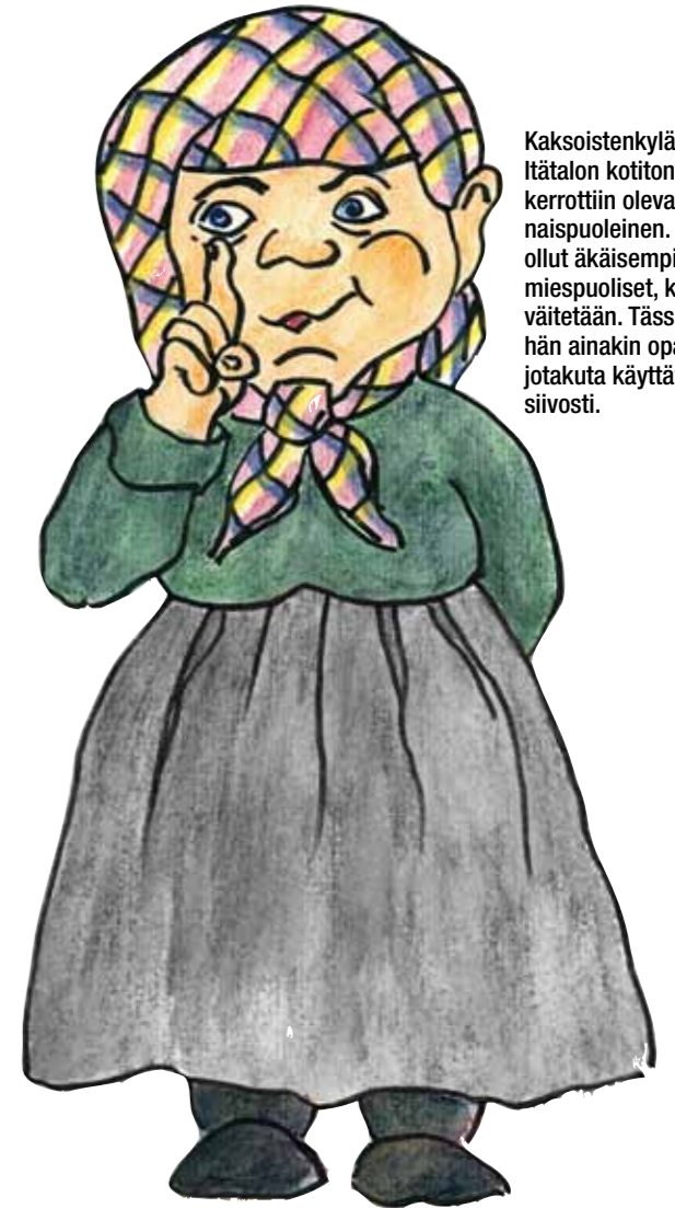
Kaksoistenkylän Itätalon kotitontun kerrottiin olevan naispuoleinen. Liekö ollut äkäisempi kuin miespuoliset, kuten väitetään. Tässä hän ainakin opastaa jotakuta käyttäytymään siivosti.

nykyajan joulutonttujen hahmot ilmestyivät tanskalaisen taiteilijan Constantin Hansenin kynästä 1836. Niissä punanuntuiset tontut tanssivat joulupuurokullhon ympärillä ja leikkivät kissojen kanssa. Joulutonttuperinne alkoi levitä ensin Tanskassa ja sitten muual- lakin Euroopassa. Suomeen nämä joulutontut levisivät saksalaisten ja ruotsalaisten joulukorttien myötä 1850-luvulla. ☘