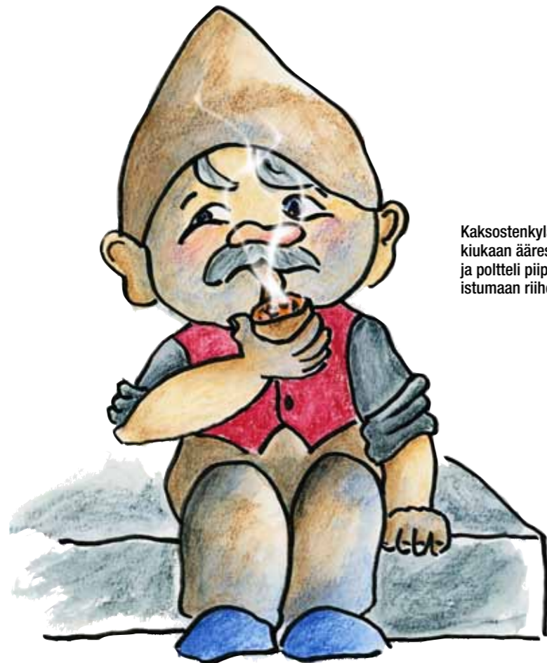
Kaksoistenkylän Länsitalon haltia. Riihen kiukaan ääressä se istuksi punaset liivit yllään ja poltteli piippua. Kuvassa se on tullut ulos istumaan riihen astinkivelle