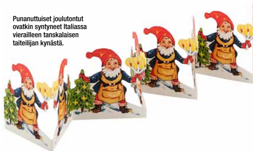
Punanuntuiset joulutontut ovatkin syntyneet Italiassa vierailleen tanskalaisen taiteilijan kynästä.

Nykyään hyväntahtoiset tontut kuuluvat jouluun. Ensimmäiset