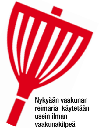
Nykyään vaakunan reimaria käytetään usein ilman vaakunakilpeä

Vaakuna jäi epäviralliseksi kotiseutuvaakunaksi vuonna 2009, kun Merimasku yhdistyi Rymättylän ja Velkuan kanssa Naantalina kaupunkiin. Merimasku-Seura on pyrkinyt vaalimaan entisen Merimaskun kunnan vaakunaa ja pitämään sitä arvokkaasti esillä. ☚