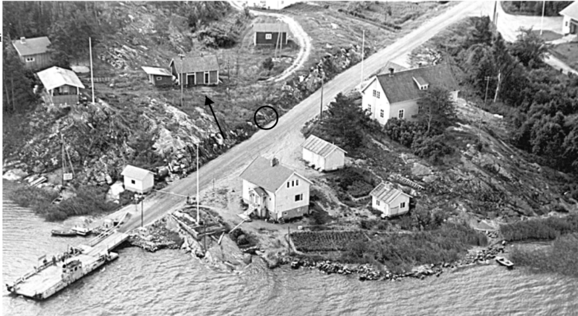
Kuva lossirannasta joskus 1950-luvun puolelta. Rannassa näkyvät vielä vanhan lossituvon perustukset selvästi uuden tuvan lipputangon ympärillä. Nuolella on merkattu kunnantalon puusee/liiterirakennus ja ympyrällä rappuset, joita pitkin sinne oli kavuttava. Tien toisella puolella olleet kunnantalolta jobitaneet raput jäivät kuvassa piiloon.