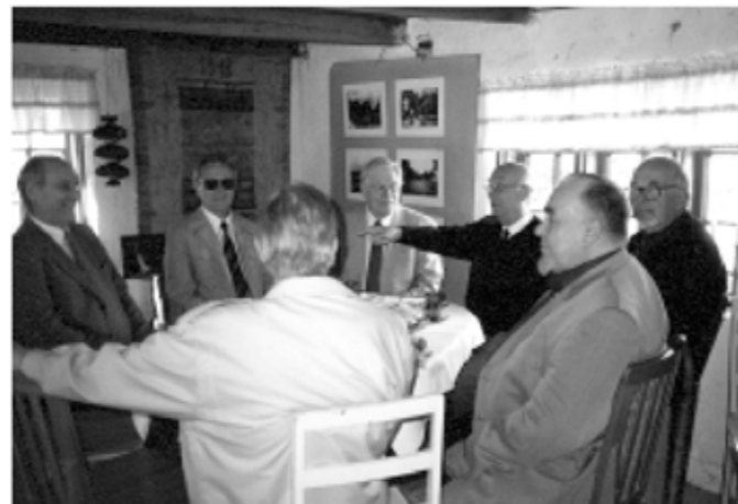
Monenlaisia muisteluja on Kollolan kahviossa käyty. Tässä vuorossa Särkan sillan "veteraanit".