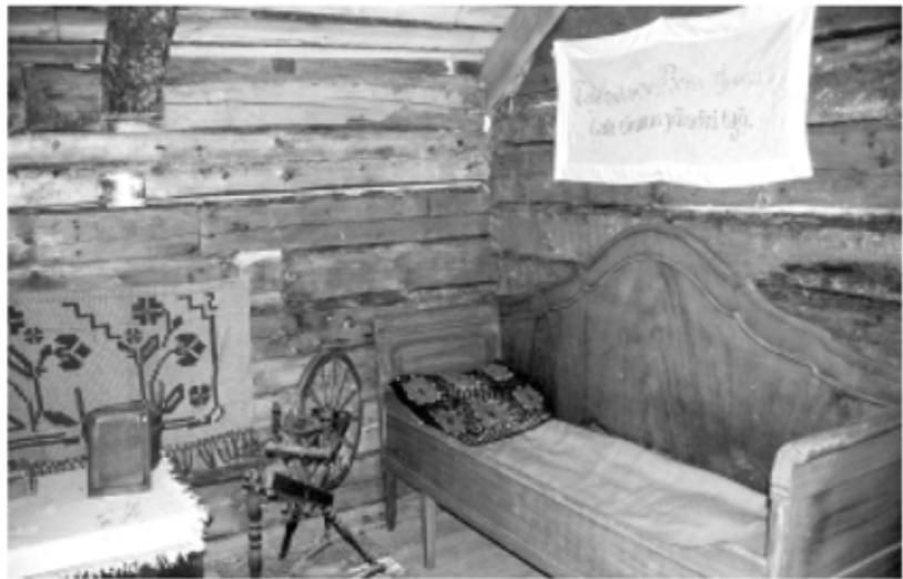
Piiankamari odottaa pihanperälle piipabtnutta asiijaansa. Kesä oli asumisen kannalta vapaampaa aikaa, sillä aitat olivat kylmillään talvella joten piijat ja rengit siirtyivät asumaan tupaan.