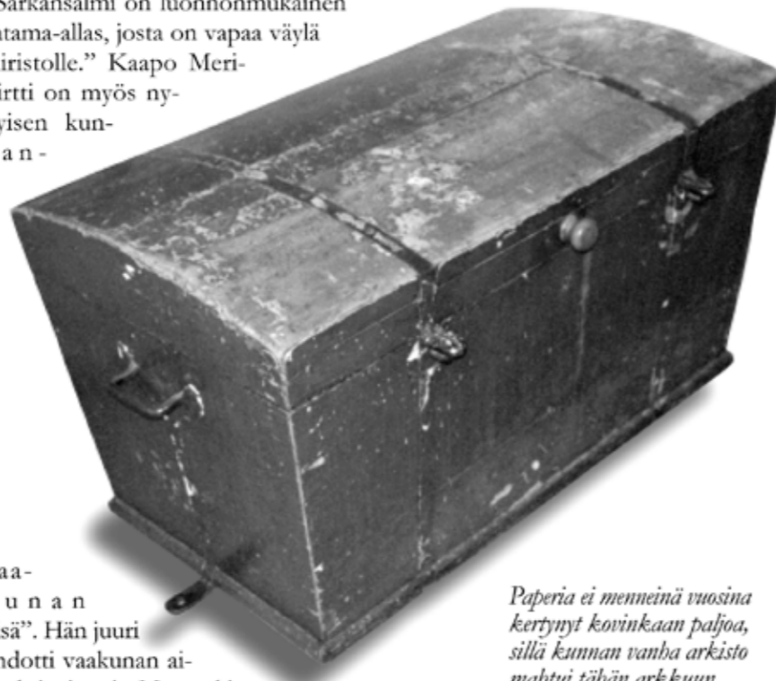
Paperia ei menneinä vuosina kertynyt kovinkaan paljoa, sillä kunnan vanha arkisto mahtui tähän arkkuun.