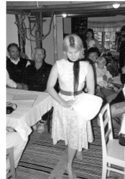
Muisteluvuorossa muotia 50 -luvulta.