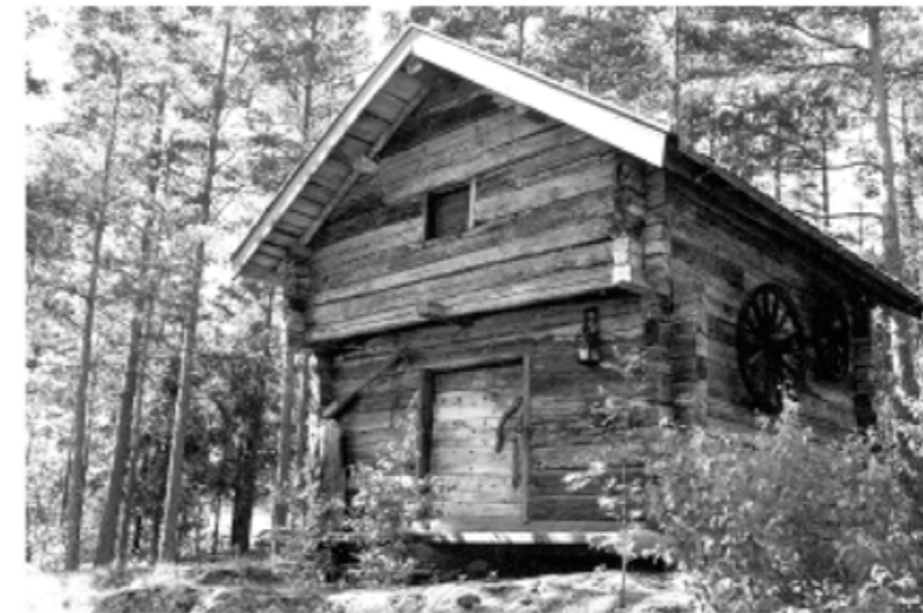
Varastoaittoja saattoi pihapiirissä olla ennen useita. Vaatteet, turkikset, palvatut libat, vilja, tarveaineet, kaikki omilla aitoissaan. Asumiseen aittoja käytettiin vain kesäisin.