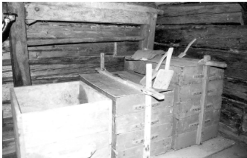
Mansikkakistu ja niiden päällä puisia mansikkalapioita