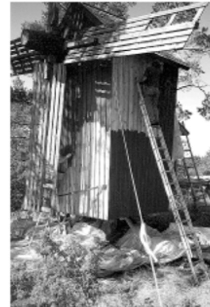
Kräkilän myllyn kunnostus on saanut kiitosta myös Maakuntamuseolta.