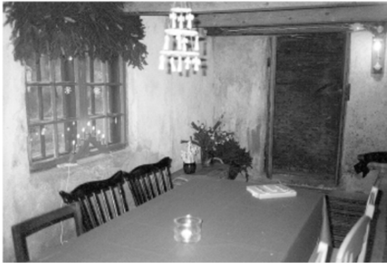
Navetan kahvio oli alussa vielä melko ankea