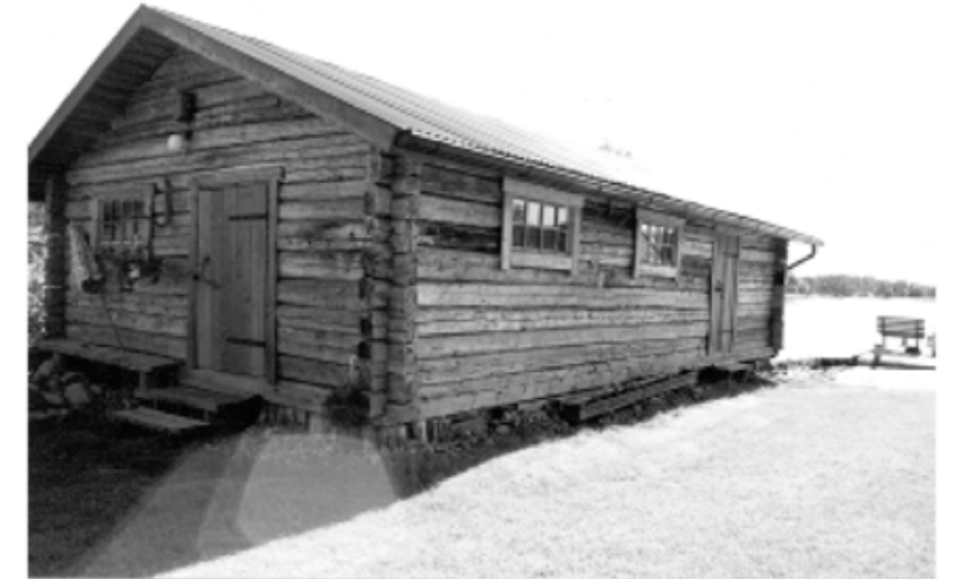
Venevaja, kuten muutkin pihapiirin vanhan oloiset rakennukset on rakennettu vanhan, puretun rakennuksen hirsistä