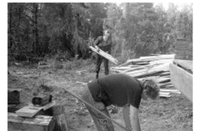
Naiset ovat osallistuneet talkootöihin muutenkin kuin vain kahvinkeittäjinä.