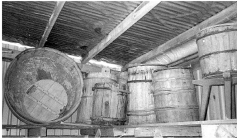
Silakan ja muiden kalojen suolaukseen käytettyjä astioita. Puusta tehtiin kaikki mahdolliset säilytys- ja tarvekalut. Puu oli halpaa ja helposti muokattavaa materiaalia, jota oli saatavana kaikkialla.