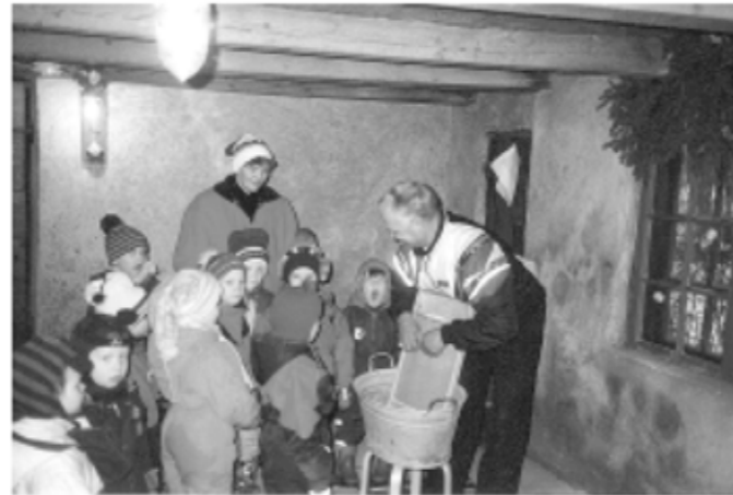
Alusta asti on Merimasku-Seura huomionnut myös lapset.

Kotiseututyön kannalta merkittävintä on ollut neuvottelukanavien luominen kunnallisten päättäjien suuntaan. Neuvotteluteitse on saatu sikäli tuloksia, että Kollolan torpan, Kollolan Kotiseututalon merkitys on tajuttu kuntalaisten identiteettiä kohentavana ja kulttuuriannin täydentäjänä. Näin on saatu määrärahoja toiminnan kehittämiseksi. - Merkittävimpänä toteutuneena kotiseututyön kohteena voidaan pitää 1700-luvulta peräisin olevan Kräkilän myllyn entisöimistä. Toteuttamisen siemenet kylvettiin jo edesmenneen