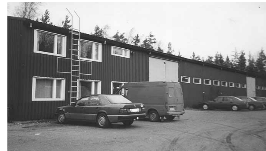
Tässä ollaan nyt. Uusi uljas konepajahalli on noussut entisten läheisyyteen