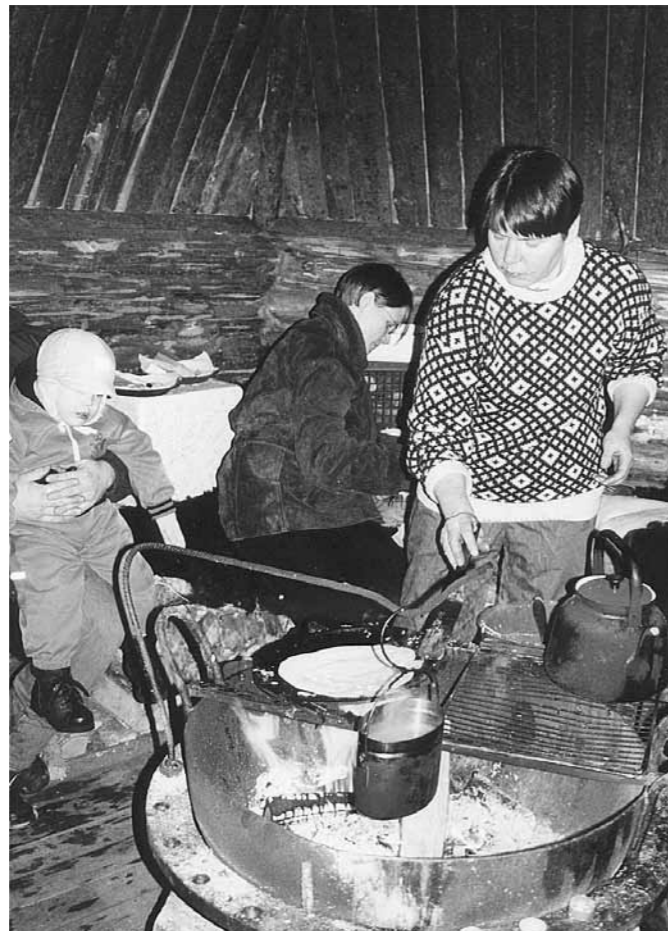
Maaseudun uusien elinkeinojen myötä on tämän päivän emäntä monessa mukana. Maaseutumatkailun myötä ovat emännän tekemät työt lisääntyneet ja päivät usein pidettyneet.

Näin alkaa selkeästi hahmottua tilan pohjapiirros, jossa voisi vaikkapa eri väreillä erottaa isännän ja emännän alueen: Isännän valtakuntaan kuuluvat pellot, työkaluvajat, metsät, tiet, joita hän talvisin auraa ja -työnjaosta riippuen karjarakennukset. Emännän hallitsemaan tilaan taas kuuluu asuinrakennus, hyötypuutarha ja koristeistutukset ja mahdollisesti karjarakennukset. Leikillään moni emäntä sanoi, että jos nainen kerran menee pellolle traktorilla ajamaan saa hän kohta huolehtia viljelystäkin muiden töiden ohella. Työnjaossa voisi siis olla kyse saavutetun aseman ylläpidostakin.