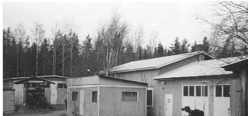
Tästä kaikki alkoi. Samassa pihapiirissä oli asuinrakennus, sauna, kanala ja korjaamohalli. Kuvassa oikealla oleva matalampi osa on alkuperäistä, vanhaa rakennusta.