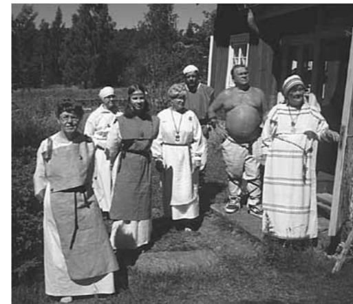
Mieleni minun tekevi, aivoni ajattelevi lähteäni laulamahan, sadani sanelemahan.....