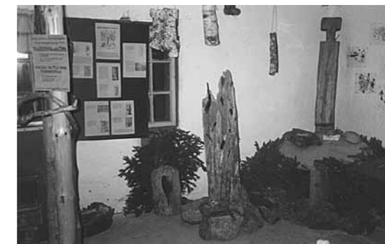
Kalevalan kansan kansanuskemukset kotijumalasta ja -haltioista sekä niille uhraamisesta, myös kansanlääkintä ja kalliomaalaukset esillä näyttelyssä.

Noin kuulin saneltavaksi, toisin tutkaeltavaksi: "Eipä koski vuolaskana laske vettänsä loputen, eikä laulaja hyväinen laula tyyntä taitoansa. Mieli on jäämähän parempi kuin on kesken katkema-han." Niin luonen, lopettanenki, herennenki, heittänenki.