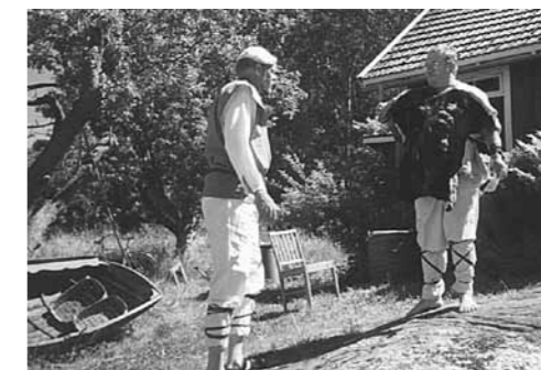
Oi on vanha Väinämöinen! Tehkäämme sula sovinto ... Teen minä sulan sovinnon, ei neittä väellä vieä, vastoin mieltä miehelähän ...

Noin kuulin saneltavaksi, toisin tutkaeltavaksi: "Eipä koski vuolaskana laske vettänsä loputen, eikä laulaja hyväinen laula tyyntä taitoansa. Mieli on jäämähän parempi kuin on kesken katkema-han." Niin luonen, lopettanenki, herennenki, heittänenki.