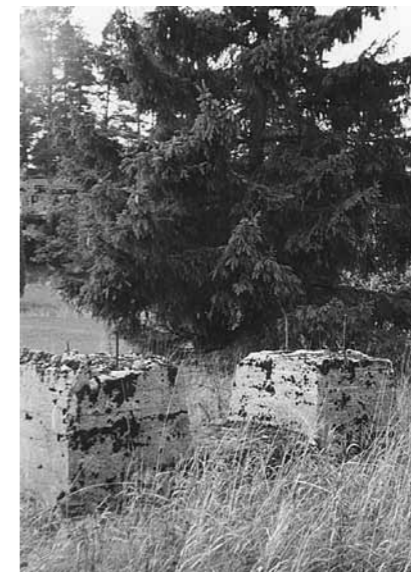
Tamsaaren rannassa on sahasta muistona enää höyläkoneen jalustan rippeitä. Kuvassa olevan kiuseen takana sijaitsee itse höyrykone ja vasemmalla oleva pelto oli sahan lautatarhaa ja kenttää. Kuvaaajan selän takana sijaitsee mylly. Siitä on rannan kalliolla vielä muistona hevosten sitomiseen käytettyjä kalliota iskettyjä renkaita.