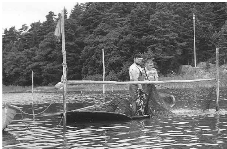
Rysä nostetaan ylös kesä - heinäkuussa

Verkkokalastusta ovat monet kesämökkiläisetkin harrastaneet, koska valmis verkko on helppo käydä kaupasta ostamassa. Vannerysiäkin kaupoissa näkee myynnissä, mutta