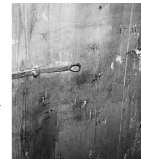
Kruunun virkamiehen jättämiä polttomerkkejä vanhan rakennuksen ovissa.

Lamavuodet 1930-luvun alussa vaikuttivat myös Merimaskussa. "Tammisaaren Saha ja Astiatehdas" ei enää kannattanut vaan se lopetettiin vähitellen. Siitä ei enää ole muistona kuin höyläkoneen jalustan jäänteet Tammisaaren rannassa ja Kruunun virkamiehen jättämät leimat vanhan talon susioissa. Vaikka enää eivät kalastajat astioita suolakalansa varten tarvitsekaan, niin kauniille puuastioille olisi varmaan vieläkin käyttöä.