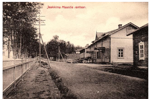
Jaakkiman kylänraitti 1911