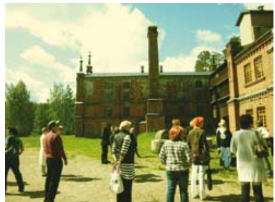
Tasa-arvoseminaarilaisia Verlan opastuskierroksella

Muutama sana tasa-arvoseminaarista Kouvola, aiheena mies tasa-arvon ongelmana .