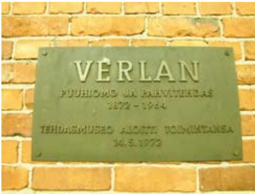
Kuva puhukoon puolestaan