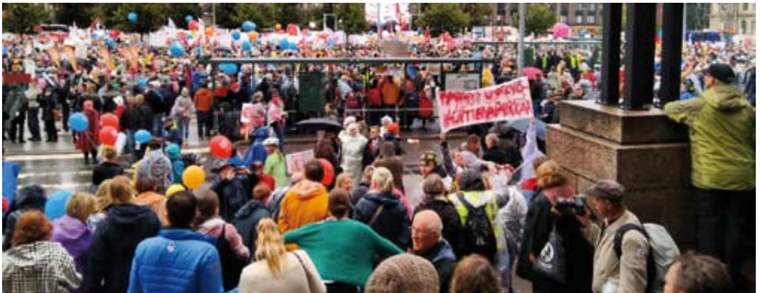
Rautatientorilla Helsingissä 18.9. oli ruuhkaa. Paikalla n. 30 000 henkeä