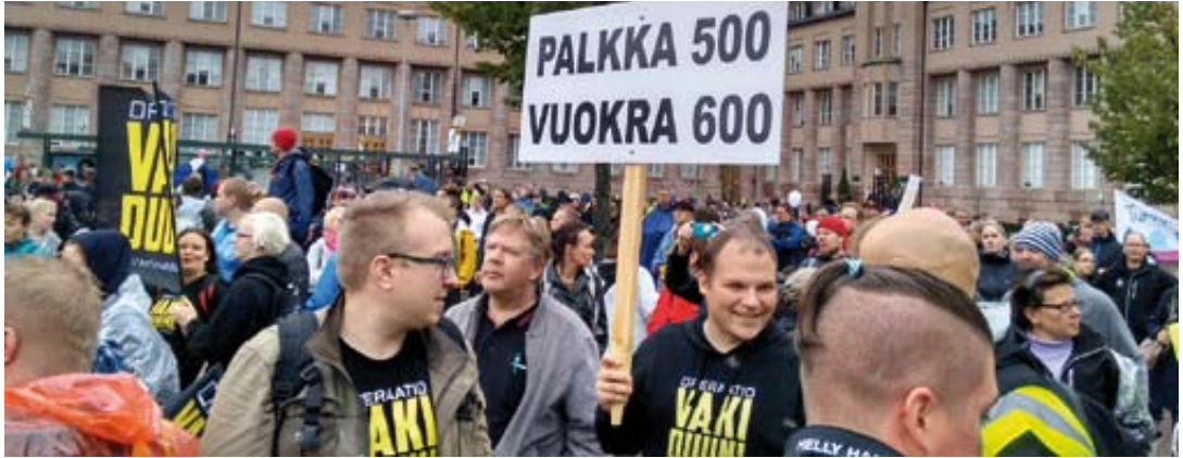
Operaatio Vakiduuni oli vahvasti mukana molemmissa mielenosoituksissa Helsingissä