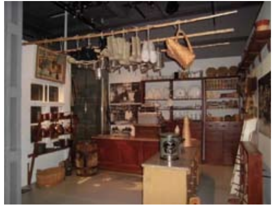
Työväenmuseosta sisältä, vanha kauppa