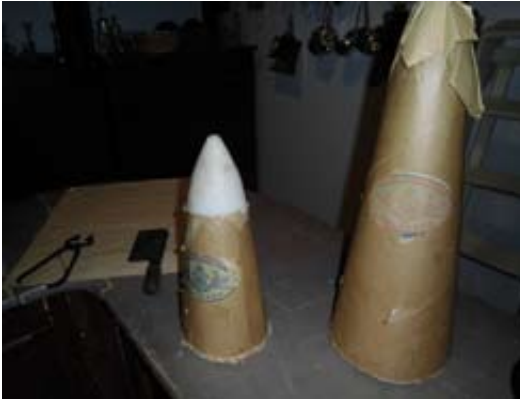
Kauppan tiskillä "toppasokeria" kaksi lieriötä