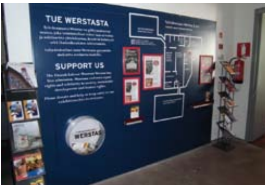
Museon päämainostaulu esitteineen

set OM, - Hlbi – yhdessä vai erikseen, - Muuttuva sanasto, - Seksuaalinen suuntautuminen, - Sukupuolidentiteetti, - Sukupuolen ilmaisu, - Fyysiset su-