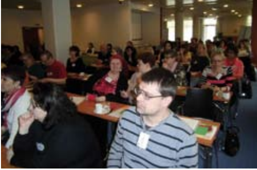
Tasa- arvo seminaariin osallistuneita

* Tasa-arvotyön tulevaisuuden haasteet, PAU lukuina, - Nykytila PAU:n edustamilla aloilla, - Työhönotto, - Palkkaus, - Työaika, - Kiusaaminen ja häirintä, - Yhteistoimintaneuvottelut ja irtisanomiset, - Erityistehtäviin valikoituminen, Työn fyysisyys, - Kiusaaminen ja häirintä, - Jäsentutkimus: Miesten ja naisten vastaukset lähes identtisiä koskien liiton toimintaa niin menneen kuin tulevaisuuden osalta.