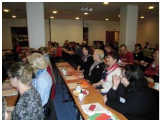
Tasa- arvo seminaariin osallistuneita