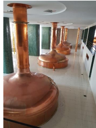
Uuden osan kattiloita, joilla tuotetaan olutta 9,7 miljoonaa hehtolittraa vuodessa.