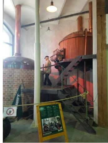
Tässä panimomestari panee maailman ensimmäistä kirkasta vaaleaa lager-olutta, josta ensimmäinen erä putkahti lokakuussa v. 1842.