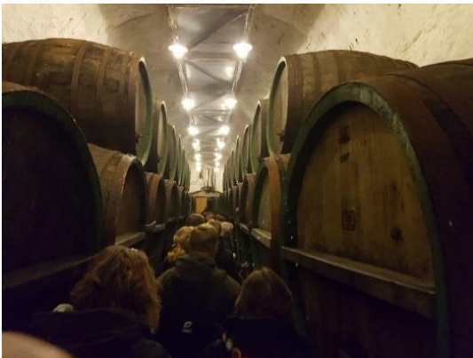
Kävimme vanhoissa kellareissa, jotka ovat käsin kaivettuja yli 170 vuotta sitten. Kellarin käytäviä on n. 9 kilometriä ja osa niistä on kunnostettu vierailijoille. Täällä pääsimme maistelemaan pastöroimatonta olutta tammitynnyreistä.