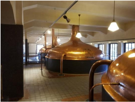
Vanhemman osan käytöstä poistettuja kattiloita.