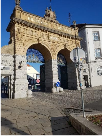
Pilsner Urquellin kaksiovinen portti, joka on tuttu firman logosta ja tuopin alustoista.