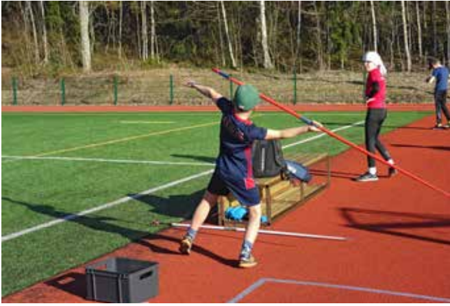
Keihäänheittoharjoitukset liikuntahallin kentällä keväällä 2021.