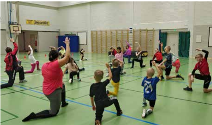
Venyttelyä ei unohdeta myöskään lasten yleisurheilutreeneissä.