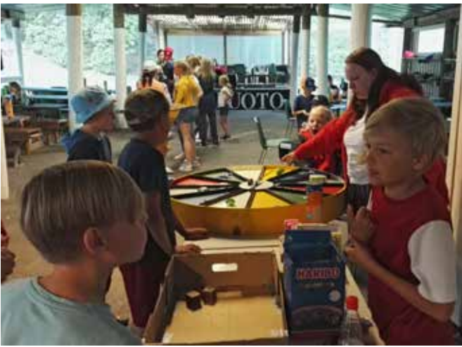
Leirin diskossa nopan heittoa ja ruletin pyörittämistä.