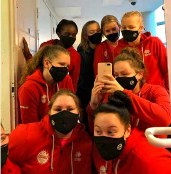
Lentopallojaosto hankki seuran logolla varustettuja maskeja.