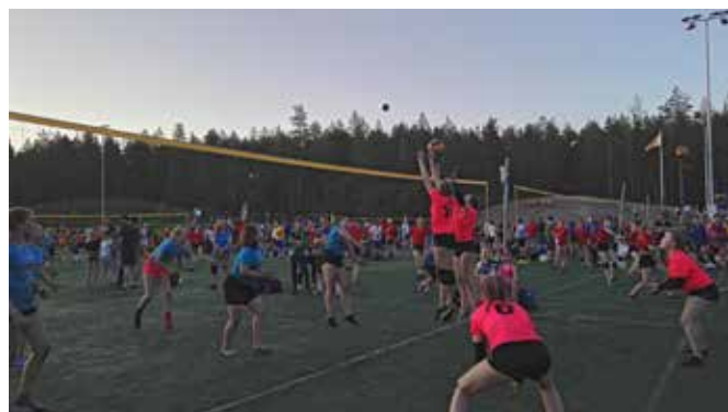
C-tytöt pelasivat Power cupissa yöttömän yön lentopalloa. Selin Kehityksen C-tytöt.