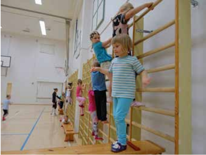
Liikuntakoulussa harjoitellaan mm. kiipeilyä....