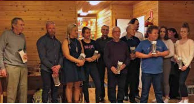
Kiitokseksi vuoden työstä ohjaajat saivat vuoden 2019 joulujuhlassa juomapullot.