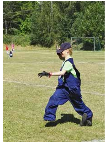
Leiriolympialajeissa yhtenä oli isoissa vaatteissa juokseminen.