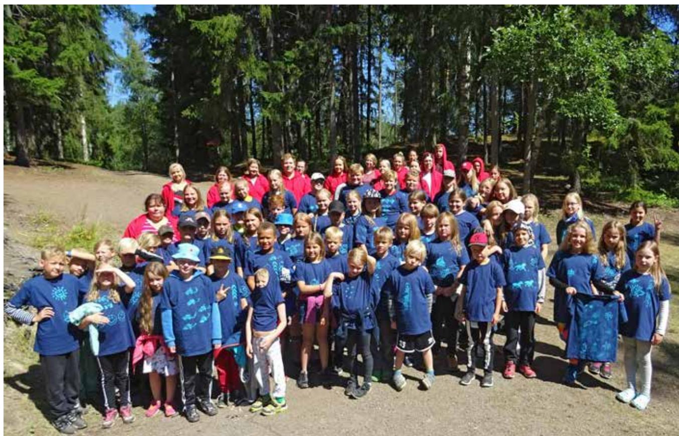
Ohjaajat ja leiriläiset yhteiskuvassa.