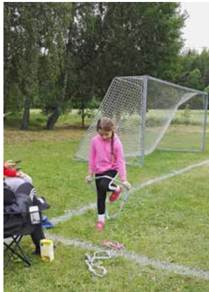
Leiriolympialaisten yhtenä lajina on pujotus.