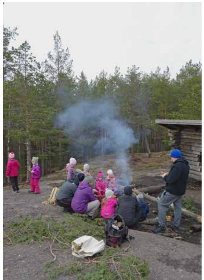
Liikuntakoululaiset laavuretkellä Linnavuorella huhtikuussa 2021.

Järjestämme lapsille vuosittain Leiripäivän ja diskoja. Seuraa: piikkionkehitys. sporttisaitti.com