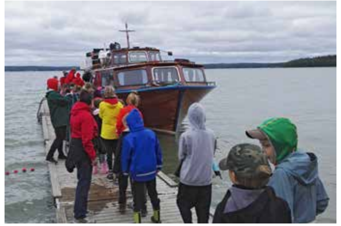
Leiriläiset lähdössä Harvaluodon ympäri vesibussilla.