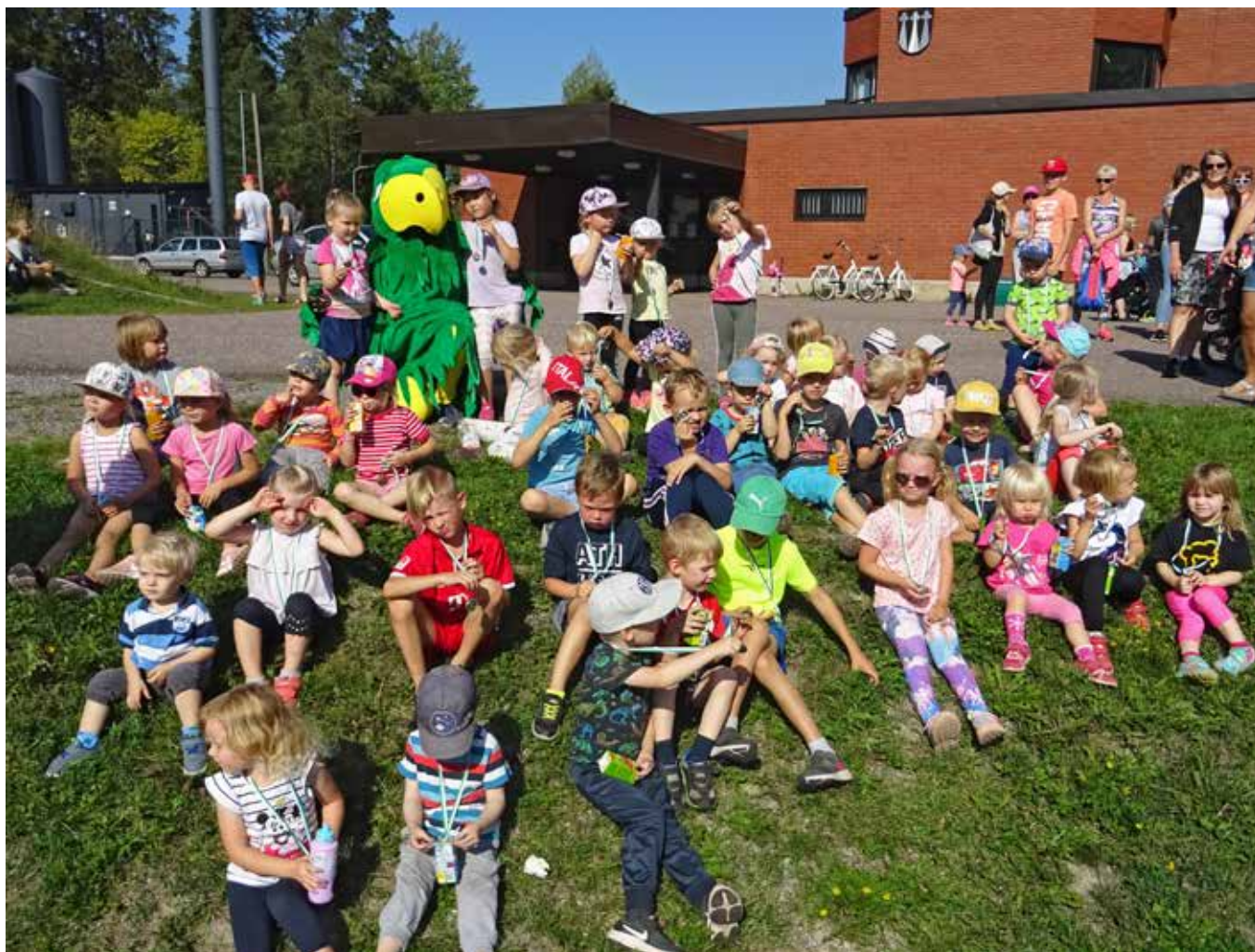
Poppi yleisurheilukilpailut saatiin järjestää aurinkoisena syyspäivänä 2019.