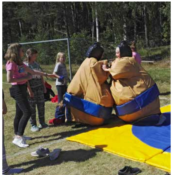
Sumopainoasut saatiin kaupungin Nugipagusta.