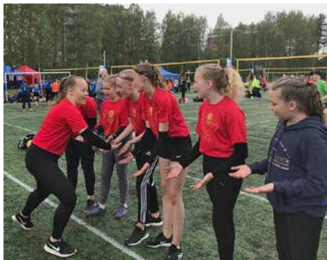
D-tytöt voitettun pelin jälkeen Power cupissa.