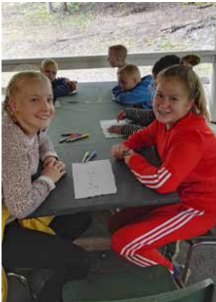
Leirin alussa suunniteltiin teltan nimeä.