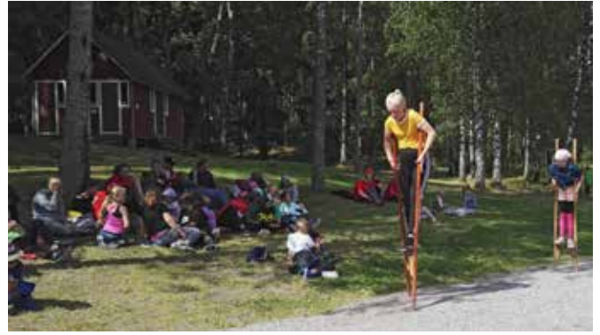
Leirillä kisattiin ja harjoiteltiin puujaloilla kävelyä.