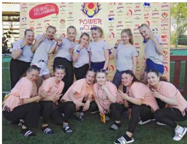
Vuoden 2019 Rovaniemellä lentopallon Power cupissa. C-tytöt menestyivät loistavasti sijoittuen tsemppisarjassa 8. pistesijalle. Kuvassa ylärivissä D-tytöt ja alarivissä C-tytöt.