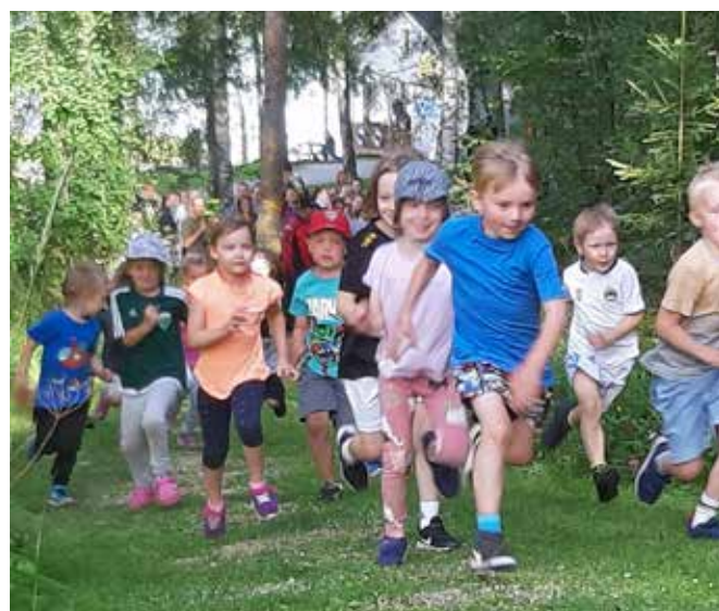
Ensimmäistä kertaa järjestettiin Harvaluodossa Poppi-maastojuoksukilpailut. Huima 150 osanottajan joukko juoksi pururadalla omilla ikäsarjoissaan.