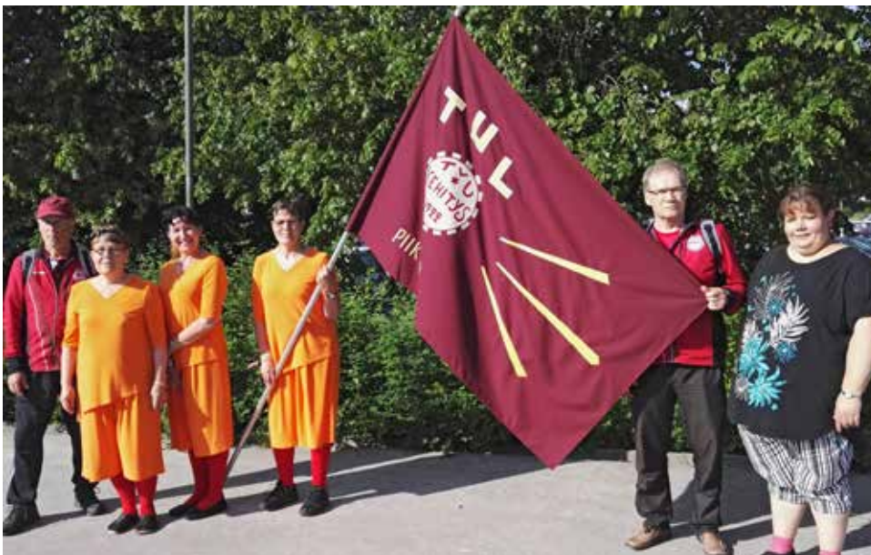
Kehityksen pieni joukko TUL:n 100-vuotis juhlavuoden liittojuhlilla 2019 Helsingissä.