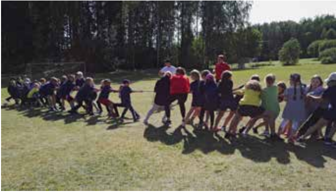
Köydenvetokisassa tytöt vastaan pojat.