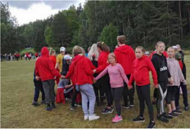
Leirillä leikittiin paljon eri leikkejä. Yhtenä tutustumisleikkinä oli solmu.