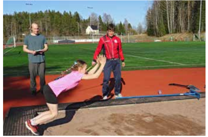
Pituushyppyharjoitukset liikuntahallin kentällä keväällä 2021.