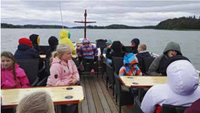
Leiriläiset vesibussin kannella.