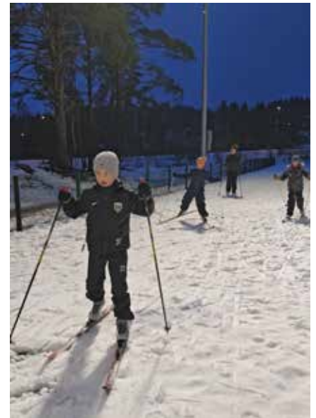
Hyvän talven ansiosta yleisurheilijat pääsivät myös hiihtämään harjoituksissa.