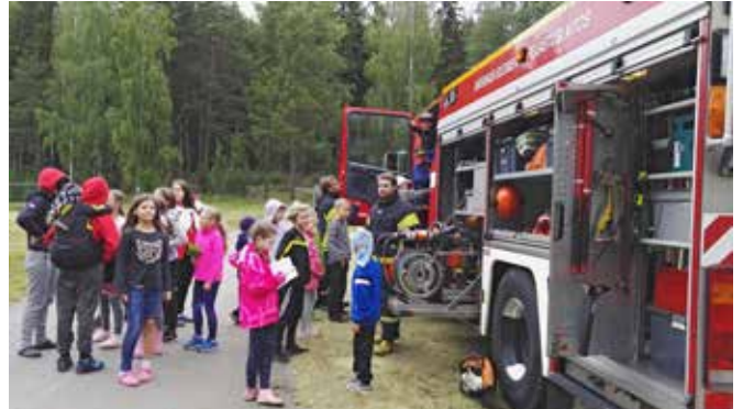
Piikkiön VPK:n kalustoesittely.