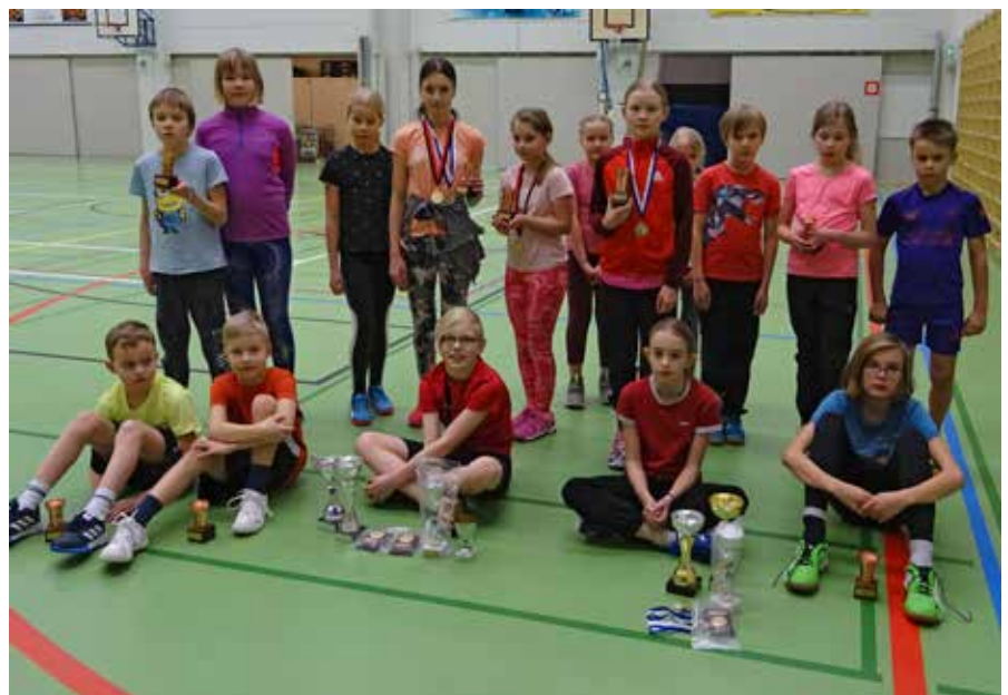
Kauden 2020 ahkerimmat ja menestyneimmät alle 13-vuotiaat urheilijat palkintoineen harjoituksen lomassa.

Tue seuraa antamalla tilauskoodi 10065, saat 10 € alennuksen. Verkkokaupan kassalle mennessä anna seuran tilauskoodi ennen muita tietoja.