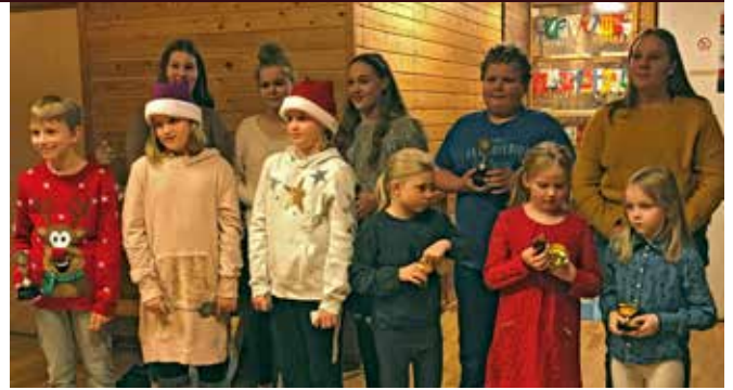
Ahkerat juniorilentopalloilijat palkittuina vuoden 2019 joulujuhlassa.