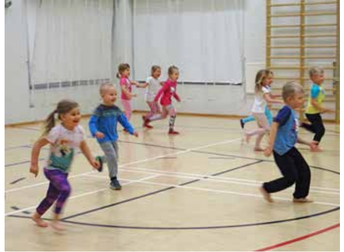
... ja liikuntaleikkejä.

Liikuntakoulut 4 - 6 -vuotiaille ja yli 7 -vuotiaille. Tarkemmat tiedot: piikkionkehitys.sporttisaitti. com