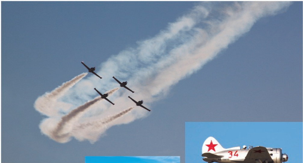
LET-ryhmä kaarrossa tehostesavujen kanssa