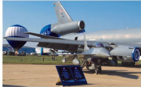
Takana KC-10 tankkeri, edessä F-16

Ranskalaiset ovat historiallisista syistä olleet aina mukana MAKS -tapahtumassa, usein taitolentoryhmällä, ja niin oli nytkin Ranskasta Rafale-hävittäjän soolonäytös. Soolonäytöksiä oli Rafalen lisäksi perjantaina useita, mm. venäläisten SU-27, SU-32, SU-34, SU-35, MIG-29, MIG-29 OVT, MIG-29, MIG-35, ja amerikkalaisten F-15. Lisäksi esiintyi suuri joukko helikoptereita ja pienempiä siviililentokoneita.