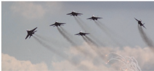
Russian Knights 6xSu-27