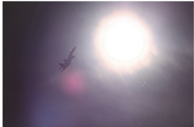
Yksi MAKS-näytöksen ongelma: parhaat kuvaussuunnat ovat kohti aurinkoa