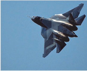
Suhoi T 50 PAK

Kone esiintyi ammattilaispäivinä ilmassa paremmin nähtävänä, mutta perjantain yleisöpäivänä se teki vain ylilennon kahden vanhemman Suhoi –tyypin välissä, josta sitä oli vaikea saada kameran tähtäimeen.