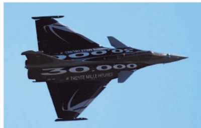
Dassault Rafale 30.000 lentotuntia lennettynä