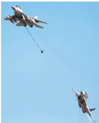
Tankkausta voi tehdä kahdella hävittäjällä