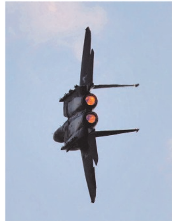
F-15 jälkipolto on todellakin päällä