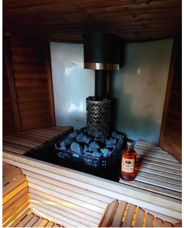
Uusi kiuas vihittiin käyttöön, perinteiden mukaisesti, Kuopion Insinöörien tarjoamalla jaloviinalla.

Remontin tavoitteena oli vaihtaa INSSIsaunaan uusi Narvin kiuas, joka on nyt kesän korvalla saatu vihdoon paikoilleen ja onnistuneesti koeajettu. Uusi kiuas oli aiempaa suurempi, joten muutoksia tuli tehdä kiukaan tukirakenteista katon läpiviintiin saakka. Tämän lisäksi kesällä 2020 uusittuja lauteita täytyi lyhentää hieman.