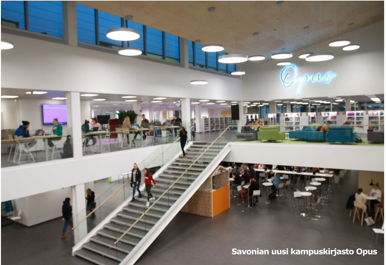
Savonian uusi kampuskirjasto Opus

Kuopiossa Savonia-ammattikorkeakoulun opiskelijat aloittivat tänä syksynä opiskelun Microkadun kampuksella, Novapoliksella. Opinnot aloitti kampuksella noin 1500 ammattikorkeakoulun tutkinto-opiskelijaa enemmän kuin edellisenä lukuvuonna. Uudet opiskelijat ovat tekniikan ja muotoilun opiskelijoita, jotka muuttivat legendaariselta TeKulta eli Opistotien kampukselta.