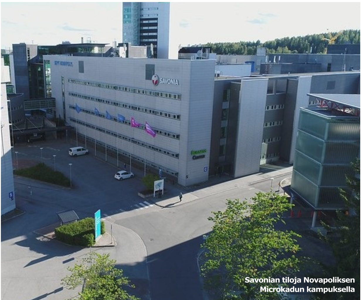
Savonian tiloja Novapoliksen Microkadun kampuksella