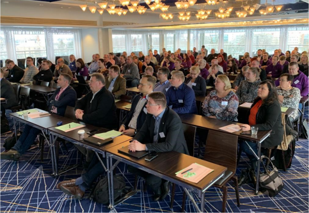
Järjestöjohdon neuvottelupäivien osallistujia.

Insinööriliitolla on vuoden aikana sääntömääräiset kokoukset keuhällä toukokuussa ja syksyllä marraskuussa. Näiden virallisten kokousten lisäksi Insinööriliitto järjestää vuosittain tammi-helmikuun vaihteessa järjestöjohdon neuvottelupäivät, tutummin JJNP.