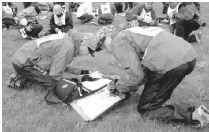
Retkisarja lintujen tunnistamistehtävän kimpussa

Lauantaipäivän tuulisella reitillä testattiin mm. paikallistietämystä Kuusiston historiallisen piispanlinnan raunioilla, karttojen ja mittakaavojen tunnistamista sekä lokki-, silakka- ja vesikasvituntemusta. Merimerkit ja meriaiheet laulut, ensiaputehtävät, 4 kilometrin kiritaipaleen ja suunnistustehtävät selvitettyään oli teltanpystytyksen ja yörastin aika. Ruokatehtävä, silakka-pihvit perunamuusin ja pinaattikas-