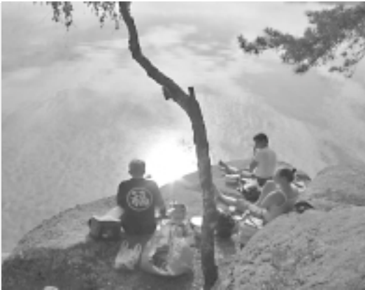
Aamiaisella Iitin Talasrannassa.