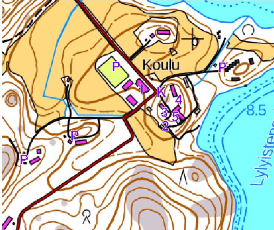
Prismarastit 2023 - kilpailukeskus