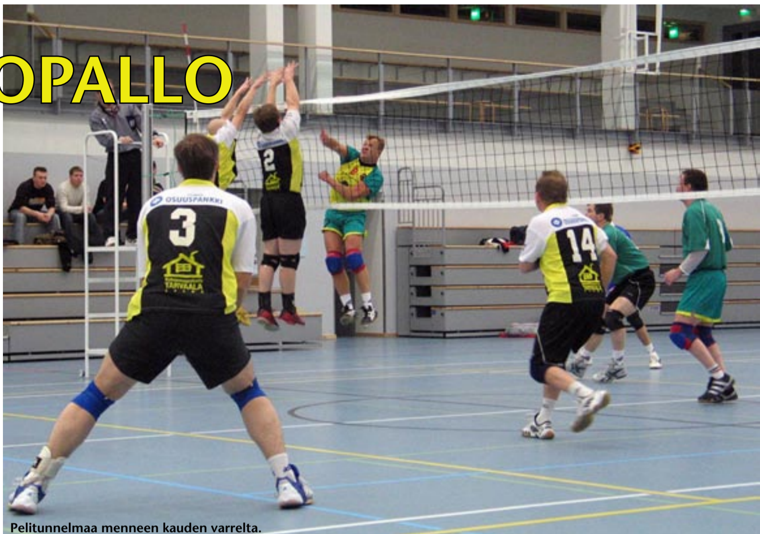
Pelitunnelmaa menneen kauden varrelta.

HARRASTUS mahdollisuudet Sysmässä ovat parantuneet huomattavasti uuden hallin valmistuttua, se on mahdollistanut myös sen että miehet, naiset sekä junnut harjoittelevat samaan aikaan. Viime talvena järjestettiin harjoitukset kaksi kertaa viikossa. Pidän myös yläasteen ja lukion tytöille lentopallo harjoituksia. Yritin innostaa heitä mukaan harrastukseen ja muutama rohkea ensikertalainenkin tuli kurssillemi. Hauskaa oli ja toivottavasti he oppivatkin jotakin. Tänä talvena moni vanhakin pelaaja oppi