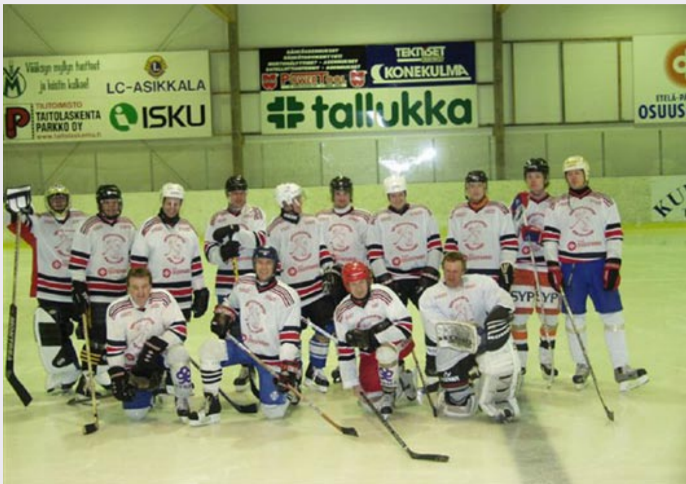
Broilers HT voitti oman Säästöpankki-turnauksen talvella 2006.

Jääkiekolla on vahvat perinteet Sysmässä ja puitteet luonnonjäällä pelaamiselle kunnossa. Mutta silti lajin harrastaminen ja etenkin sarjoihin osallistuminen pienellä maaseutu paikkakunnalla ei vain ole enää helppoa. Siihen liittyvät tekijät kyllä tiedetään mutta niihin ei paljon voi vaikuttaa. Jääkiekkoliitto ei enää panosta luonnonjäasarjojen toimintaan. Leudot ja lyhyet talvikelitkään eivät suosi ulko-