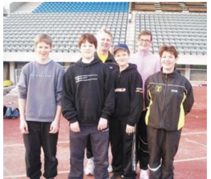
Yleisurheilun Starttikurssilaiset Lahdessa.

Sysmän Sisun yu-jaoston pj. Lahdenseudun Yleisurheilun nuoriso- ja valmennus- toimikunnan pj.