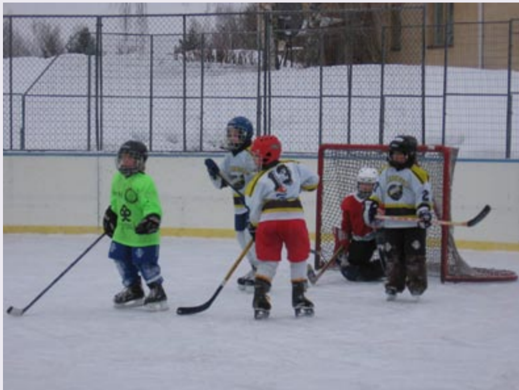
Kiekkoa pääsee pelaamaan Sysmässä jo pienestä alkaen.

jäällä pelaamista. Syntyvät ikäluokatkin ovat niin pieniä ettei junnujoukkueita oikein pystytä kasaamaan, joten uusia innokkaita kiekkoilijoita kaivataan mukaan pelaamaan.