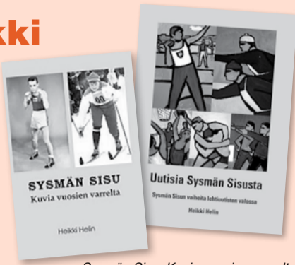
Sysmän Sisu. Kuvia vuosien varrelta on myös edelleen saatavissa.

Kirjaa on saatavissa myös Sysmän Kirjakaupasta, Sisun hallituksen jäseniltä sekä kesän tapahtumista; Hulluin lauantai-markkinat, Kirjakyläpäivät ja Uotinpäivät.