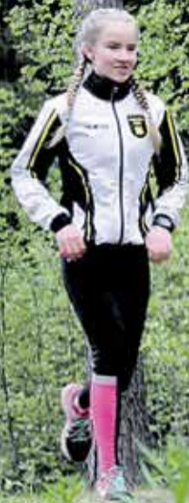
Juoksu rullaa keväisessä luonnossa. Myös rullahiihto on Katrille keskeinen harjoittelumuoto.