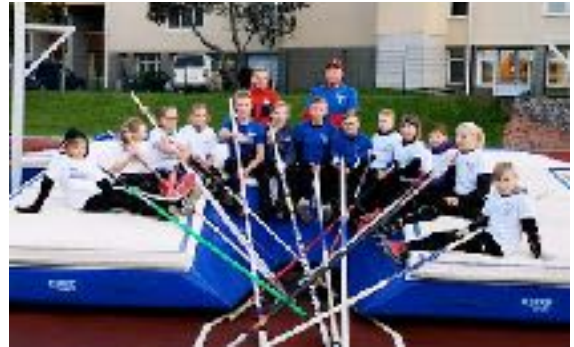
Laitilan seiväskoululaisia 2019

Seiväskouluille soveltuva opetusmateriaali on julkaistu Seivästallin kotisivuilla ja on otettavissa sieltä käyttöön tarpeen mukaisesti.