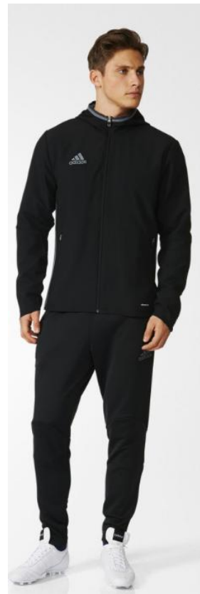
Adidas Condivo16 presentation suit.