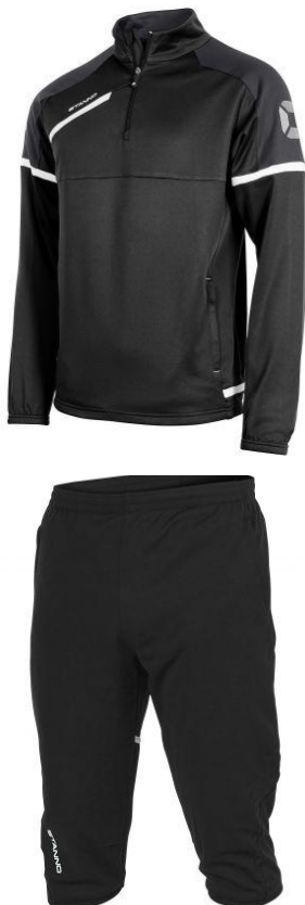
Stanno Prestige Top Half Zip & Stanno Forza training shorts.

Tämän vuoden kerhohankinta on Stannon Prestige Top Half Zip treenipaita & Stanno Forza Training shorts. Paidan tai shortsit voi ostaa myös erikseen. Hinta VEK:n jäsenille paidalle 15€, shortsille 10€ (ei jäsenille paita 25 €, shortsit 18 €). Myös VEK:n edustusasu (Adidas Condivo16 presentation suit) on tilattavissa edelleen hintaan 65 €. Erityisesti Kakkosen avustavilla VEK:n edustusasu on ottelutapahtumissa jos ei pakollinen, niin erittäin suositeltava. Asut tilataan ennen juhannusta ja niiden tilaaminen tapahtuu VEK:n kotisivuilla.