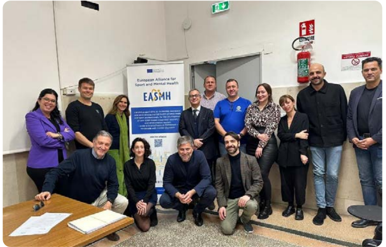
EASMH hanketapaamisessa päästiin kohtaamaan kasvusten.

HLU:n paikallisina kumppaneina hankkeessa olivat mm. Sopimusvuori ry:n Näsinkulman klubitalo sekä Nokian kaupungin mielenterveyspalvelut. Kansainvälisinä kumppaneina hankkeessa ovat mukana European Culture and Sport Organization – ECOS (Italia), Everton in the Community – EITC (Iso-Britannia), University of Campania (Italia), University of Constanta (Romania), European Platform for Sport Innovation – EPSI (Belgia) sekä European Psychiatric Association – EPA. Hankekausi oli 1.1.2021–31.12.2023.