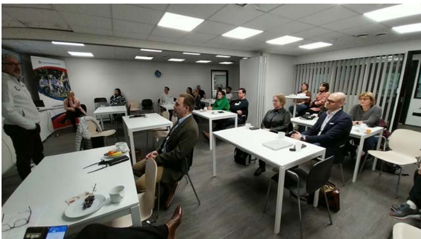
HLU:n, Suomen Olympiakomitean ja kuntien henkilöstöä yhteisessä tapaamisessa keskustelemassa ajankohtaisista liikunta-asioista.