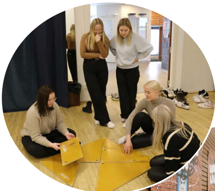
Sumeneeko ajatus? - Liike freesaa -koulutukset toisen asteen oppilaitoksille on luotu lisäämään opiskelijoiden fyysistä aktiivisuutta opiskelupäivien aikana ja virkistämään ajatuksia.

HLU oli mukana sparraamassa kuntia avustushakemusten sisällön suunnittelussa. Yhteistyössä Olympiakomitean