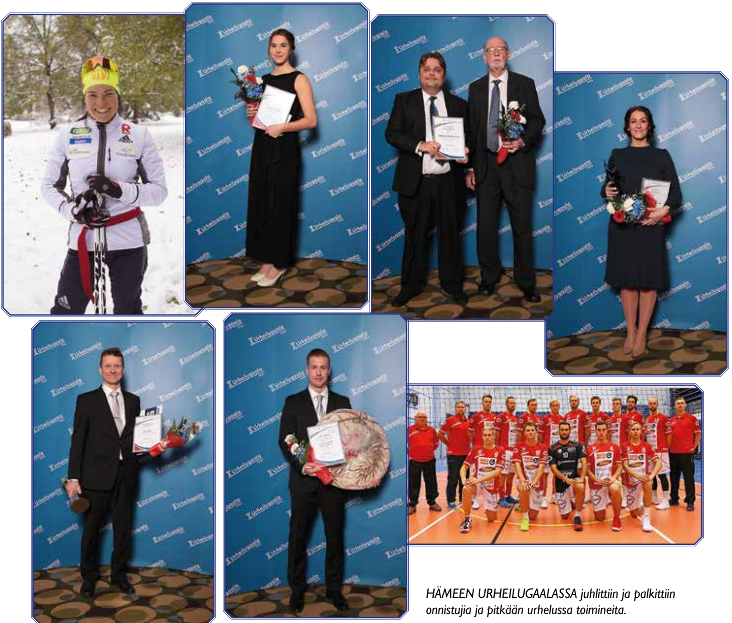
HÄMEEN URHEILUGAALASSA juhliittiin ja palkittiin onnistujia ja pitkään urhella toimineita.

HLU:n rooli seuraturkiprosessissa oli tuesta viestiminen sekä seurojen sparraaminen hakuvaiheessa. HLU myös johtaa asiantuntijaryhmää, joka antoi opetus- ja kulttuuriministeriölle lausunnon alueen hakemuksista.