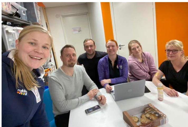
Tähtiseura-auditoinnit on hyvä paikka kohdata seuroja ja tutustua monipuolisesti niiden toimintaan.

Eniten seurakontakteja syntyi koulutuksissa, verkostotapaamisissa ja auditoinneissa. Seurojen yhteydenotoista suurin osa koski seuran hallintoa kuten mm. yhdistyslakia, työnantajana toimimista sekä verotusta.