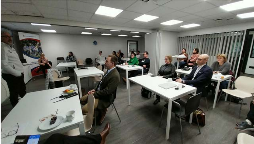
HLU:n, Suomen Olympiakomitean ja kuntien henkilöstöä yhteisessä tapaamisessa keskustelemassa ajankohtaisista liikunta-asioista.