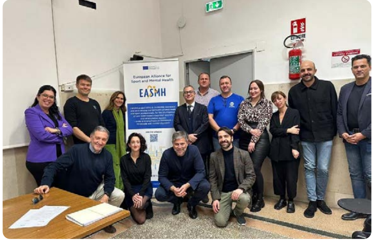
EASMH hanketapaamisessa päästiin kohtaamaan kasvusten.

HLU:n paikallisina kumppaneina hankkeessa olivat mm. Sopimusvuori ry:n Näsinkulman klubitalo sekä Nokian kaupungin mielenterveyspalvelut. Kansainvälisinä kumppaneina hankkeessa ovat mukana European Culture and Sport Organization – ECOS (Italia), Everton in the Community – EITC (Iso-Britannia), University of Campania (Italia), University of Constanta (Romania), European Platform for Sport Innovation – EPSI (Belgia) sekä European Psychiatric Association – EPA. Hankekausi oli 1.1.2021–31.12.2023.