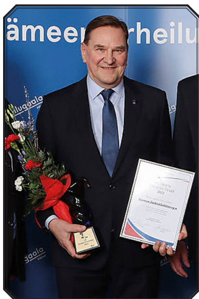
Suomen Jääkiekkoliitto - MM-kotikisat Tampereella