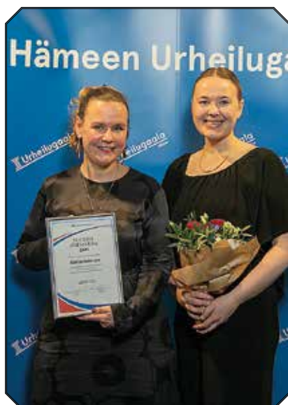
Elixia Sport ry