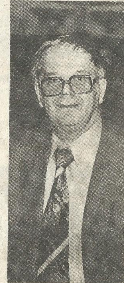
Jos keihäänheittäjä on tä- nään kunnossa eikä louk- kaantumista tapahdu, hän on huomannut, että ei