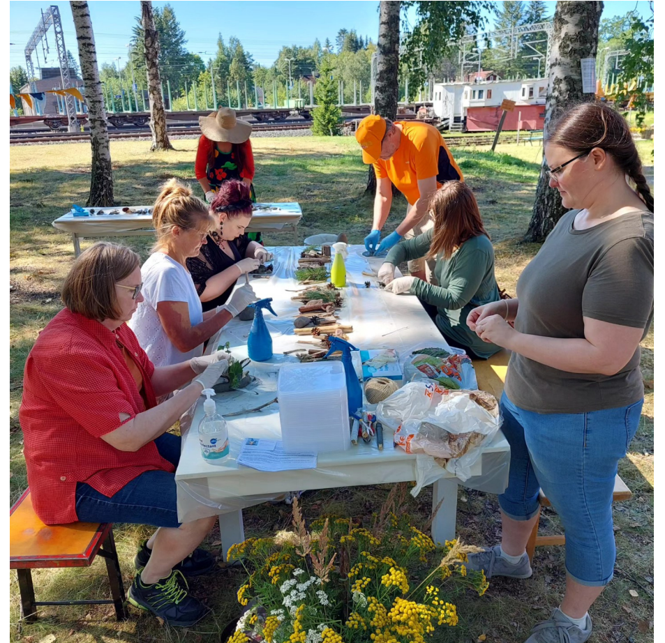
Taidekaravaani-hankkeen taidetyöpaja Akaassa.