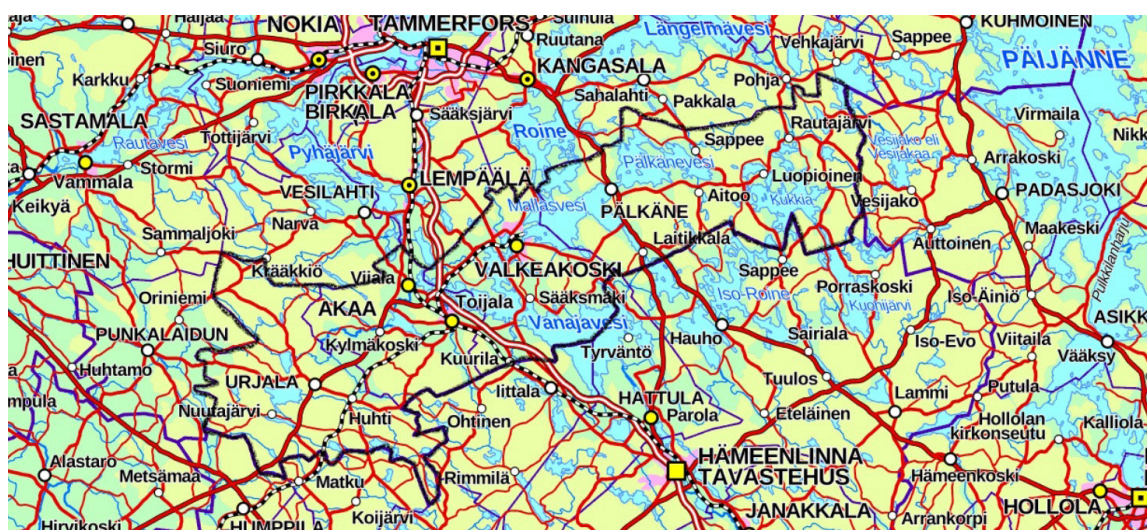
Toiminta-alue merkittynä kartalle.

kun paavi Benedictus XII julisti vuonna 1340 sääksmäkeläisiä talonpoikia pannaan. Alueella on erittäin kaunis luonto ja rikas menneisyys. Maata alueella on alettu viljellä noin 1500-luvulla ennen ajanlaskun alkua ja alue olikin pysyvästi asutettu jo kansainvaelluksen aikoihin 400–800-luvuilla. Rautakaudelta on tehty runsaasti arkeologisia löytöjä. Alueen kaikki peltoviljelyyn sopiva maa on otettu käyttöön viimeistään 1100-luvulla.