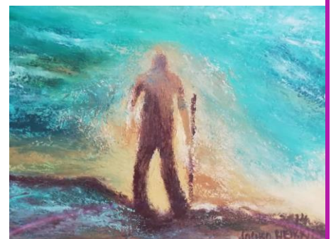
Mies nousee mustasta merestä