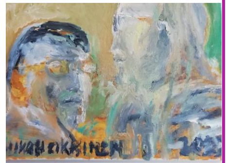
Joukon maalama oma kuva kesä 2022