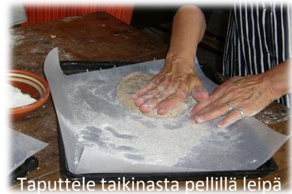
Taputtele taikinasta pellillä leipä