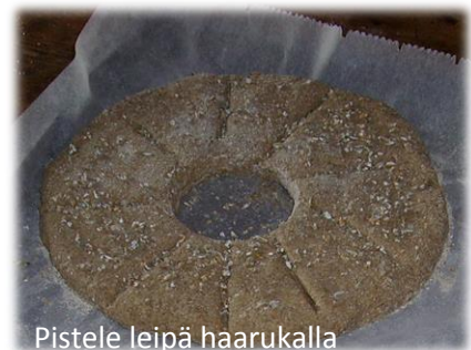
Pistele leipä haarukalla