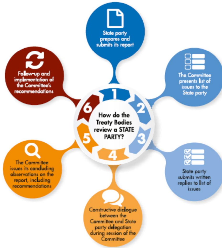
FIGURE 1. STANDARD REPORTING PROCEDURE