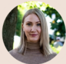
Pinja Perholehto, Kansanedustaja, Hyvinkään kaupunginvaltuuston pj.