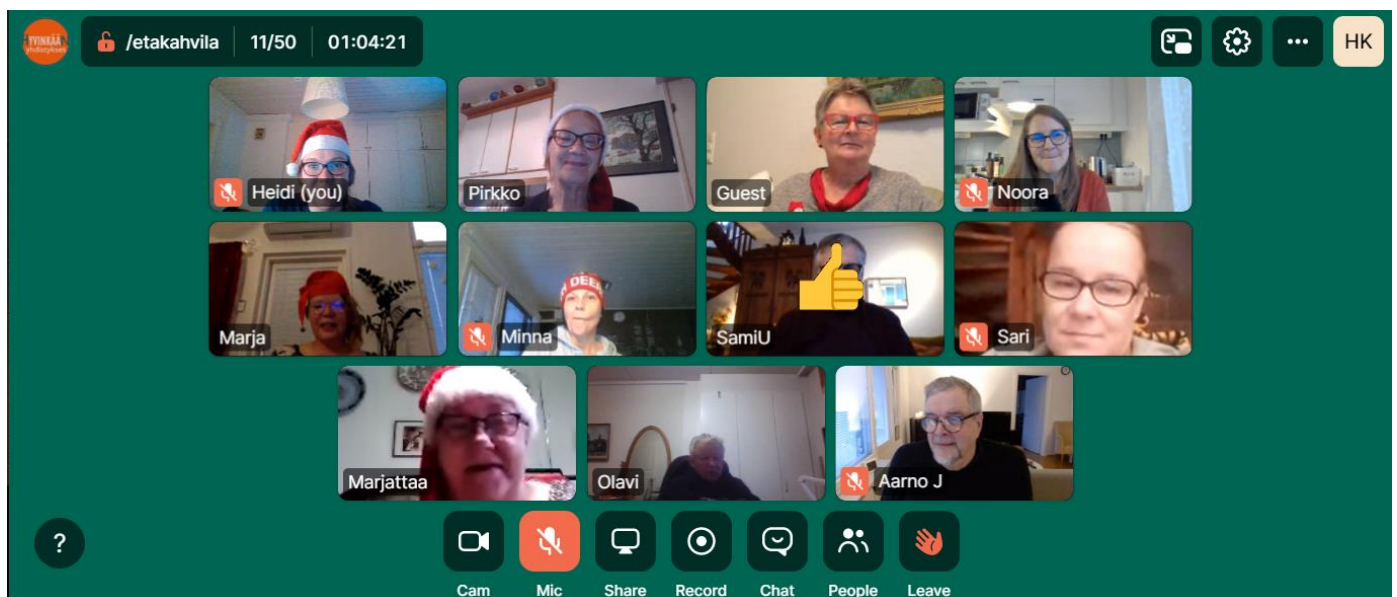
Etäglögit Whereby Pro -alustalla, kuva Heidi Kokko