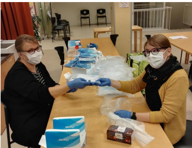
Kasvomaskoja yhdistyksille

Toiminnanjohtaja kävi kuukausittain esimiehen yksilötyönohjauksessa ja henkilökunta työryhmän yhteisessä työnohjauksessa. Ak -toiminnan puitteissa osallistuttiin toimintavuoden aikana 25:een Soste:n, Stea:n ym. järjestämään koulutustapahtumaan tai webinaariin.