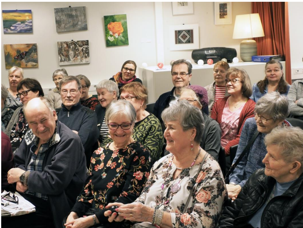
Onnensillan Ystävänäpäiväjuhlat 14.2.2020

Tehtiin digiloikka, reagoitiin ripeästi ajan haasteisiin, voi- mavarat yhdistäen. Matka jatkuu!