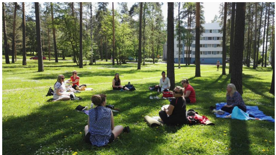
Valikkoryhmän tapaaminen

Yhteistyö eri sosiaali- ja terveysjärjestöjen, Hyvinkään kaupungin, Keusoten, seurakunnan, sairaalan, eri oppilaitosten sekä muiden sidosryhmien kanssa muodosti merkittävän osuuden koko toiminnan sisällöstä ja yhteistyö löysi uudenlaisia muotoja koronasta johtuen. Hyvinkään vapaaehtoistoiminnankoordinaattoreiden muodostama valikkoryhmä kokoontui edelleen aktiivisesti noin kerran kuukaudessa. Painopistealueina toimintavuonna olivat koronan aiheuttamat muutokset toimintoihin, tiedotus, vertaistuki ja ensimmäisen etävapaaehtoistoiminnan peruskoulutuksen suunnittelu sekä toteutus. Koulutukseen osallistui 11 henkilöä. Järvenpään Setlementti Louhelan kanssa virisi uudenlaista tiedon ja kokemusten vaihtoa, erityisesti koronatilanteen alkuvaiheessa, mm. etäkoulutuksesta ja -ryhmistä sekä sähköisistä alustoista.