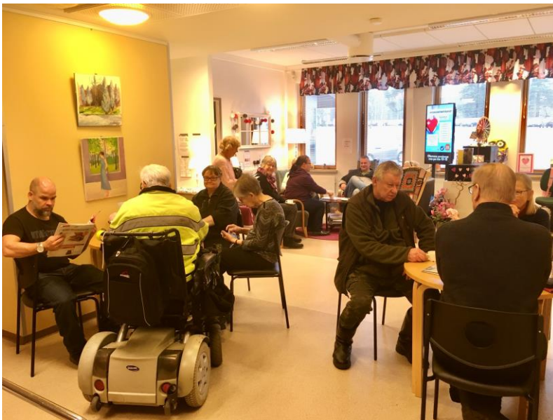
Kahvilassa väkeä alkuvuodesta 2020

vapaaehtoistyö. Koolla oli kattava joukko ikääntyneiden parissa työskenteleviä toimijoita. Opiskelijoiden rekrytoimiseksi suunniteltu Vapaaehtoistoiminta ♥ opiskelijat -tapahtuma jäi toteutumatta yhteistyössä Hyrian, Laurean ja nuorten parissa toimivien tahojen kanssa. Myös Maailma muuttuu – yhdistystoiminta muuttuu -hankkeen perinteisesti järjestämät Onnenpäivät ja Esteettömyyspäivä jäivät suunnitelun asteelle. Perinteinen vanhusten viikko seniorimessuineen siirtyi verkossa toteutettavaksi ja supistui Onnensillan osalta minimiin. Kaikille avoimia toimintaryhmiä ehdittiin järjestää 17 eri lajia, mm. Onnensillan olohuone, digitukea senioreille, tuolijumppaa, kuulolähipalvelua, sydäntuki -iltoja, bingoa, neulekahvilatoimintaa, yhteislaulua ym. Alkuvuonna Onnensillassa ehti työskennellä kaksi kuntouttavan työtoiminnan asiakasta, yksi palkkatukityöllistetty ja kolme Hyrian kieliharjoittelijaa. Työssäoppimis- ja muita paikkoja kävi kysymässä lukuisia henkilöitä, mutta koronasta johtuen jaksot jäivät toteutumatta.