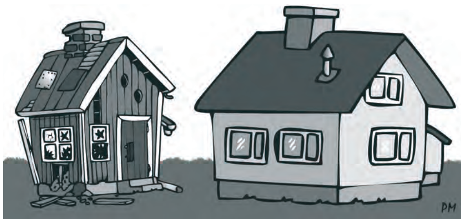
Kuva: Pertti Mäkelä 2014

Organisaatiossa tarvitaan rakenteita myös ihmisten väliselle vuorovaikutukselle, esimerkiksi kokoukset, erilaiset tilaisuudet, kehityskeskustelut jne.