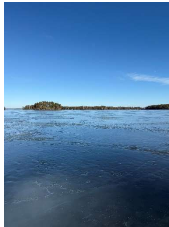
Maaliskuun 2025 alku Pirttisaaren edustalla