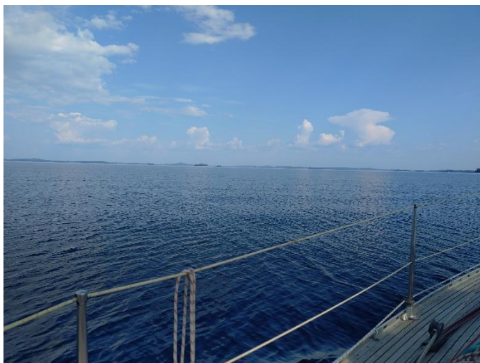
Kuva Tommi Malimaa

https://www.asikkalanpursiseura.fi/uutiset/talvipaivat/