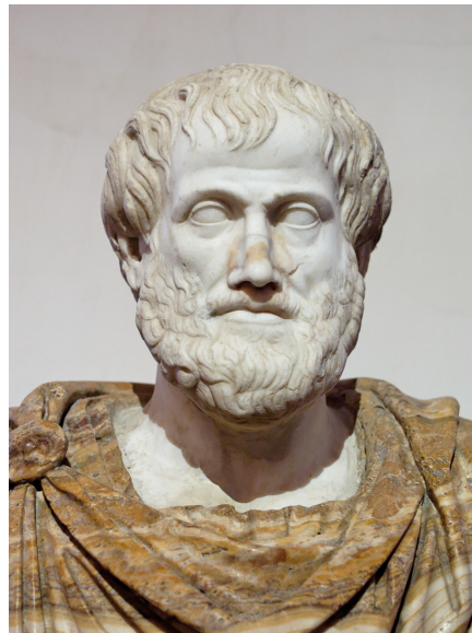
Aristoteles 384-322 eaa.