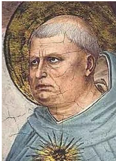
Tuomas Akvinolainen 1225-1274