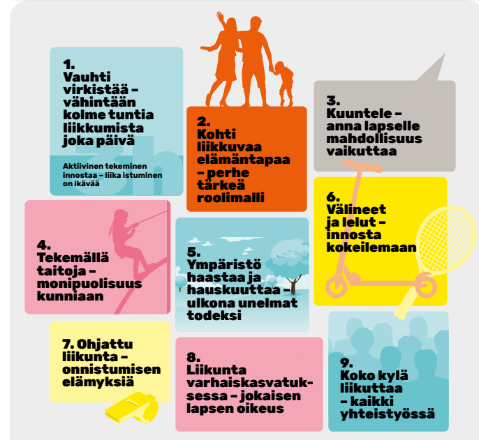
Varhaisvuosien fyysisen aktiivisuuden suositukset, 2016.

Varhaisvuosien fyysisen aktiivisuuden suositukset