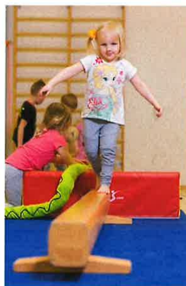
Liikunnan aluejärjestöjen kuvapankki

Olemme olleet mukana aktiivisena toimijana alueellamme toimivissa kuntien varhaiskasvattajien liikuntavastaava verkostoissa. Tammikuussa järjestimme yhteistyössä Kuopion kaupungin kanssa Pienet lapset liikkeelle- tapahtumapäivän ja joulukuussa toteutimme Tonttupolku-tehtäväpolut kahdella eri alueella.