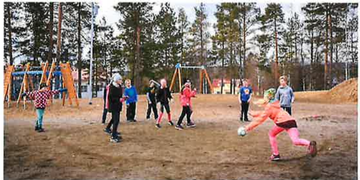
Liikunnan aluejärjestöjen kuvapankki

2. asteen oppilaitosta. Olemme sparranneet hankkeita puhelimitse, sähköpostilla ja tapaamalla hankekoordinaattoreita ja rehtoreita. Olemme tiedottaneet Liikkuva opiskelu- hankehausta ja konsultoineet hankehakemuksia. Olimme mukana Ylä-Savon ammattioppilaitoksen Liikkuva opiskelu- hankkeen ohjausryhmässä ja Savon ammattiopiston Hyvinvointi virtaa- työryhmässä. Suunnittelimme ja toteutimme lukioiden sekä ammattioppilaitosten hyvinvointipäiviä yhteistyössä oppilaitosten kanssa.