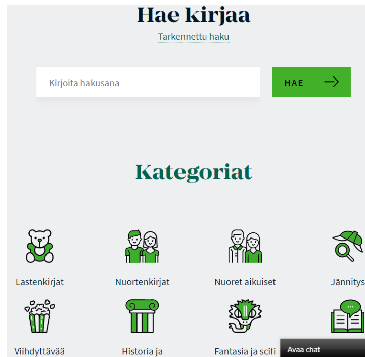
Näkymä Celianetin etusivulta