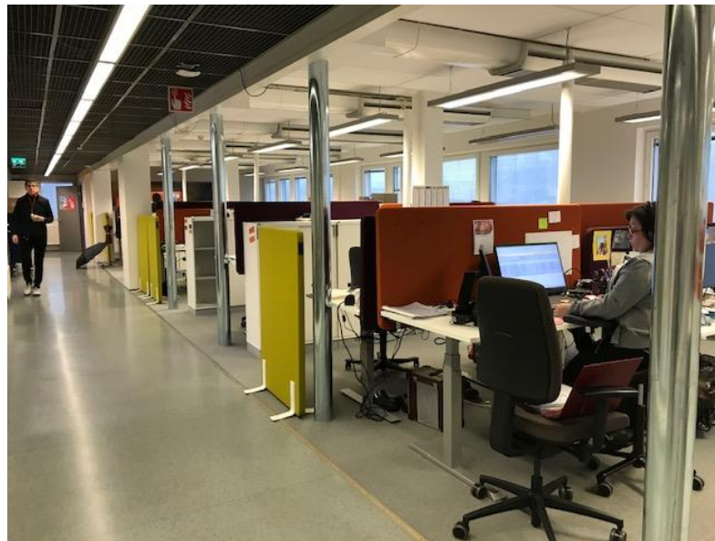
Celian henkilökunta, n. 40 henkeä, työskentelee monitilatoimistossa (vuonna 2020 pääosin etänä)