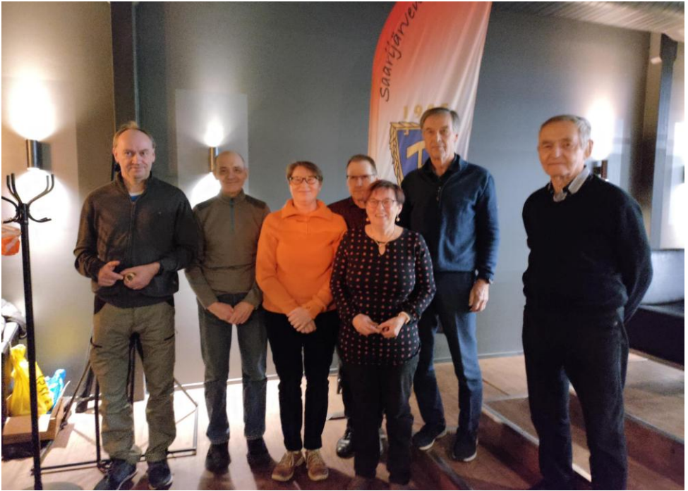
Palkitut seuranmestarit 2024