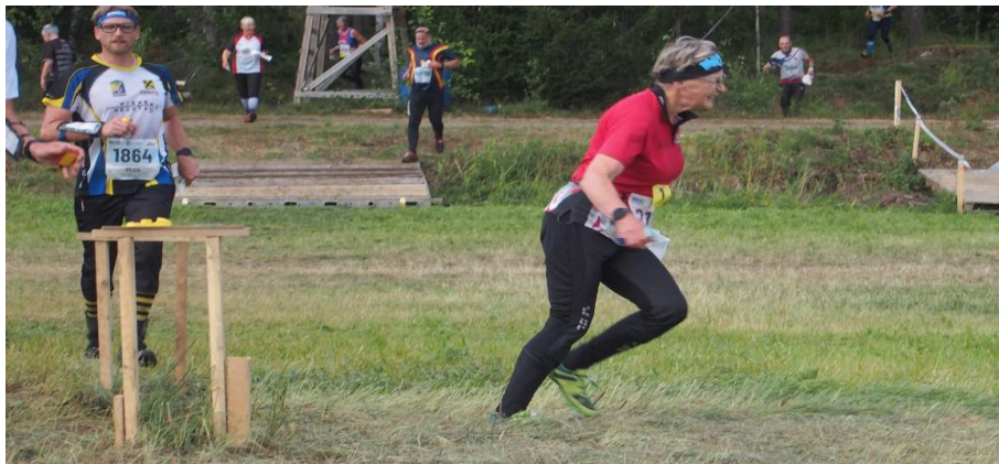
Vapun MM-kisojen maaliintulo.