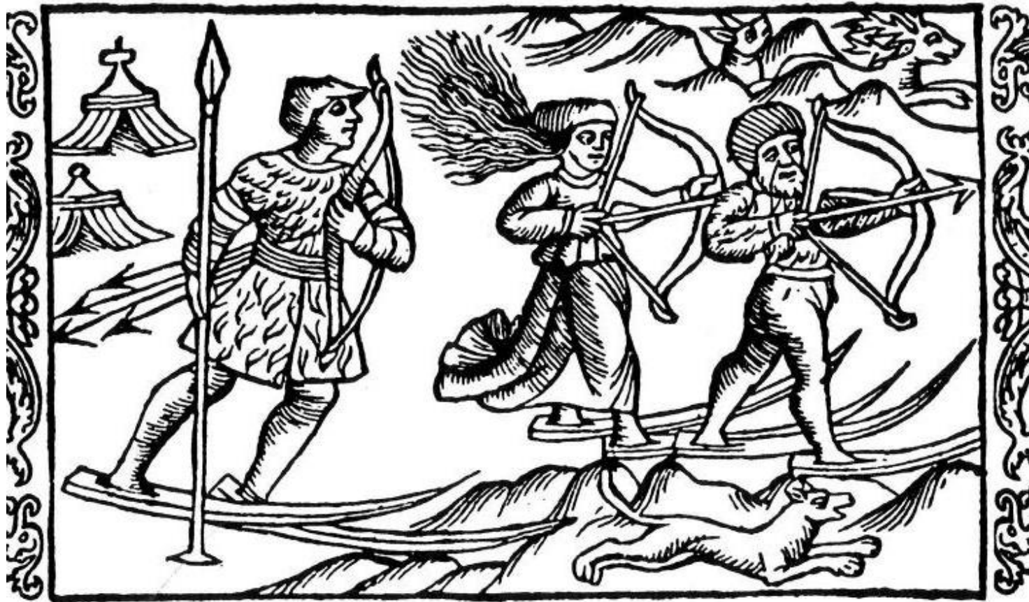
Pohjoismaista hiihtokuvitusta Olaus Magnuksen kirjassa vuodelta 1555.