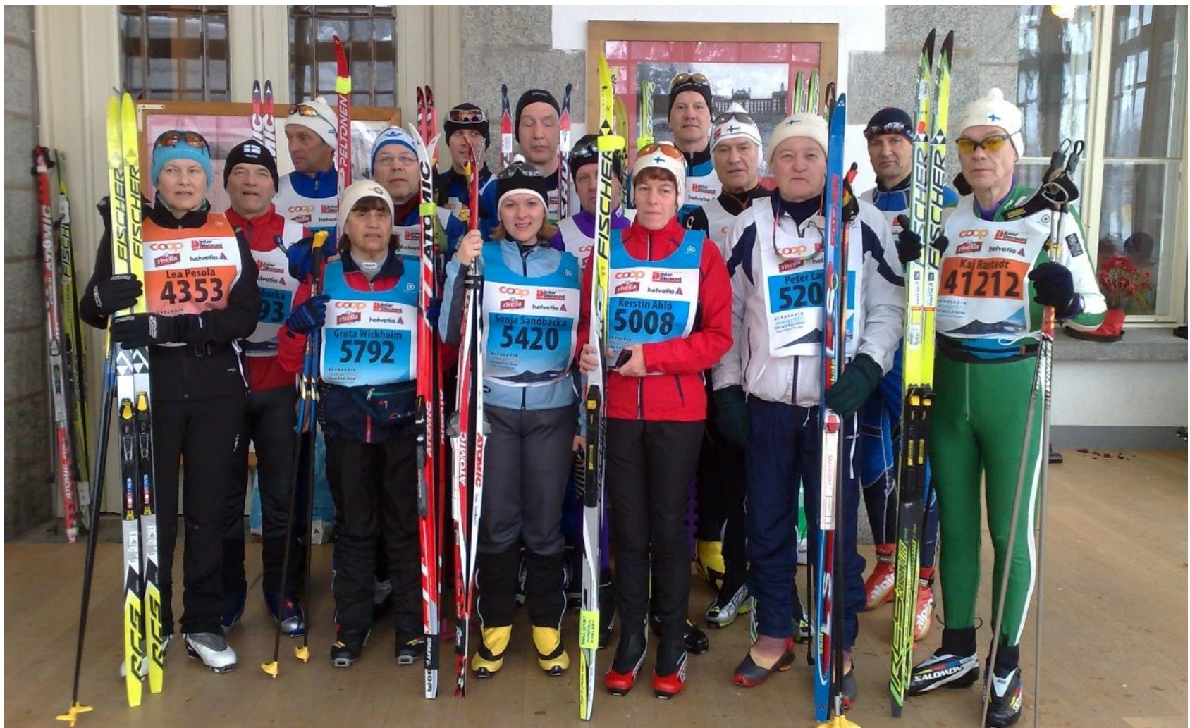
Kronoby folkhögskolas resa till Engadin 2011.