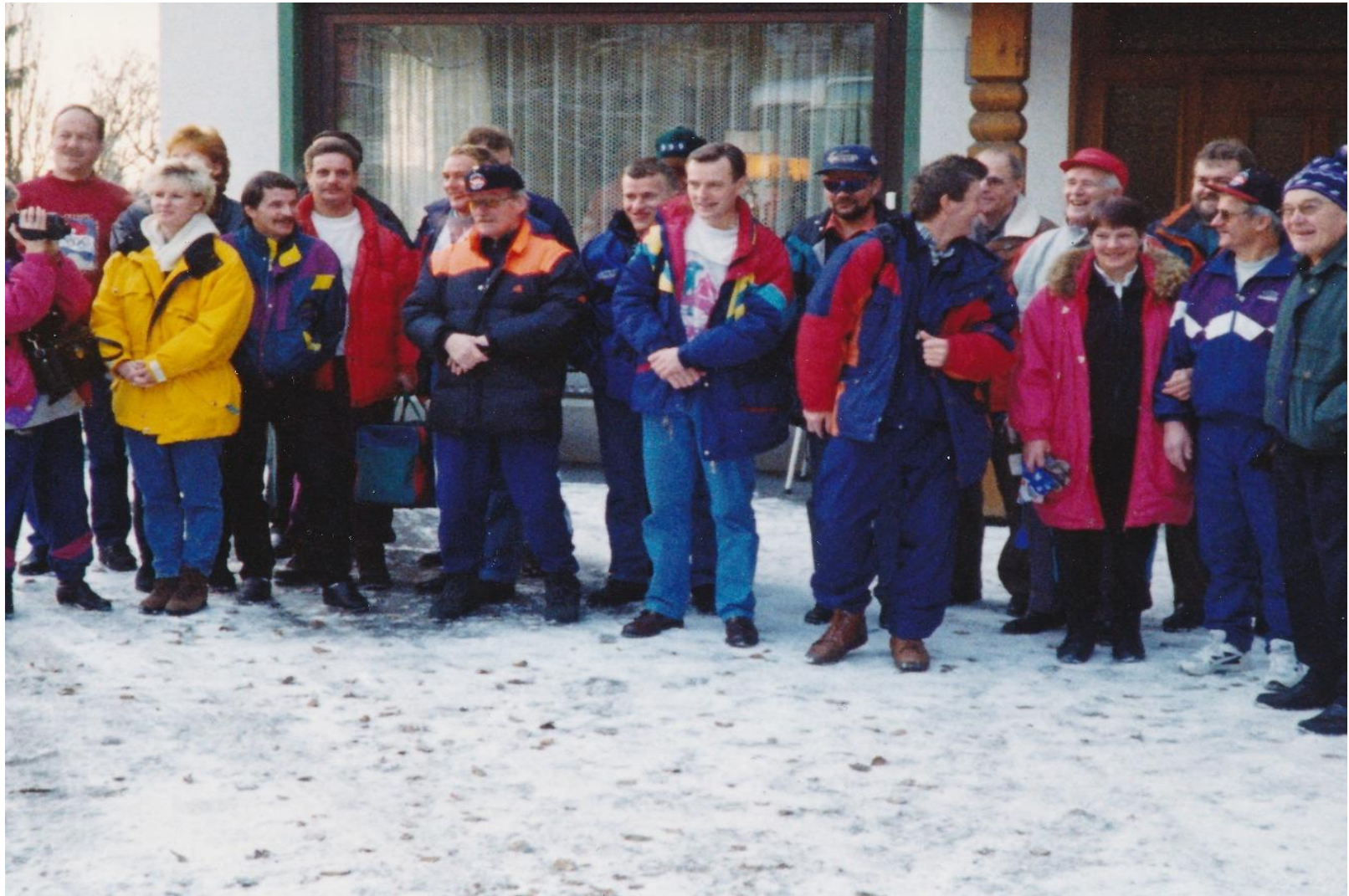
Mastereita (22) lähdössä Lienzistä Italiaan vuonna 1993.