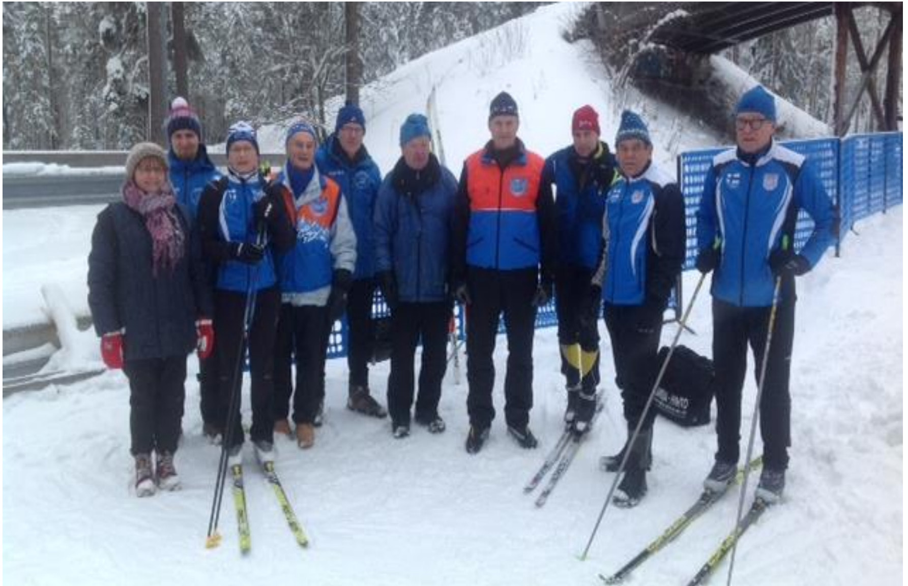
Masterit olivat vuoden 2016 ahkeroimassa Lasten Finlandiassa.