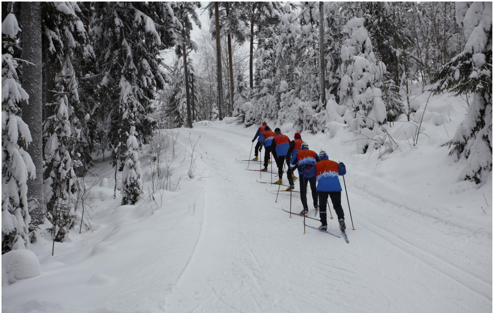
Tiirismaan laturetki Suomen Ladun valtakunnallisena hiihtopäivänä 7.2.2010 .