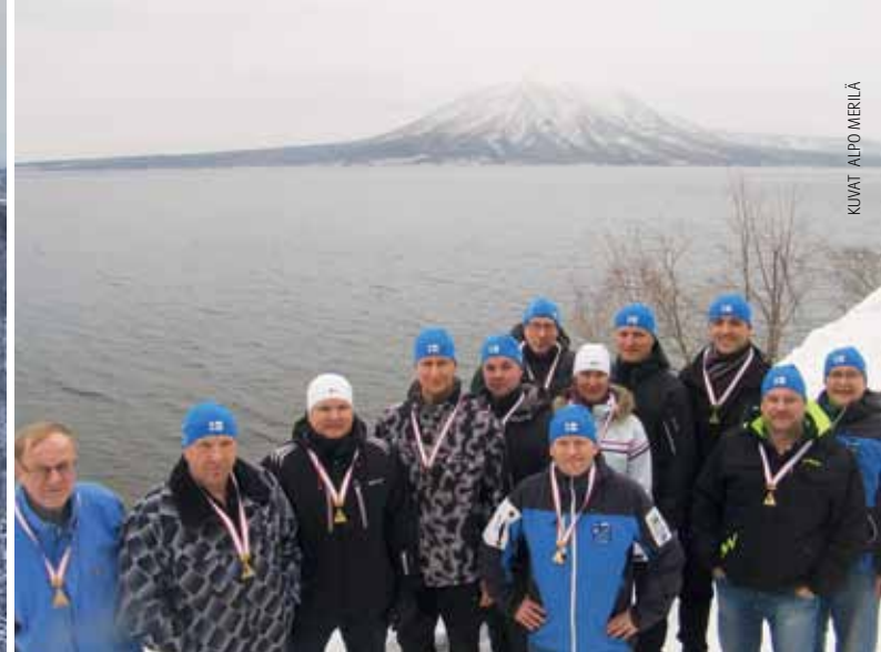
Suomalaisia hiihtäjiä kisan jälkitunnelmissa Shikotsu-järven maisemissa, joista pääsivät nauttimaan myös alppihihtäjät Sapporon olympiakisoissa 1972.

nousuissa ladusta ei ole jauhautumisen jälkeä paikoin tietoakaan.