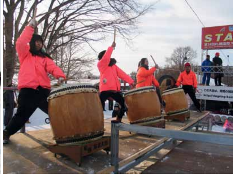
Sapporo International Ski Marathon lähtee liikkeelle paikallisten perinnerumpujen paukuksessa.

tuulet varmistavat, että Hokkaidon eli lempinimeltään ”Japanin Alaskan” ilmasto on viileä ja lunta sataa erittäin paljon.