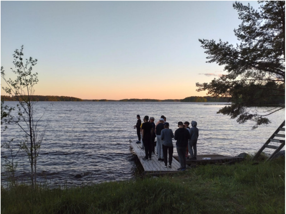
Joukkue saunaillassa Mäyriässä.

Ennen varsinaista kauden alkua joukkue kokoontui viettämään yhteistä saunailtaa Mäyriään. Kauniin kesäisen illan aikana pojat tutustuivat toisiinsa hieman paremmin jalkapalloa pelaillen, saunoen, uiden, herkutellen, kalastaen ja fribailleen.