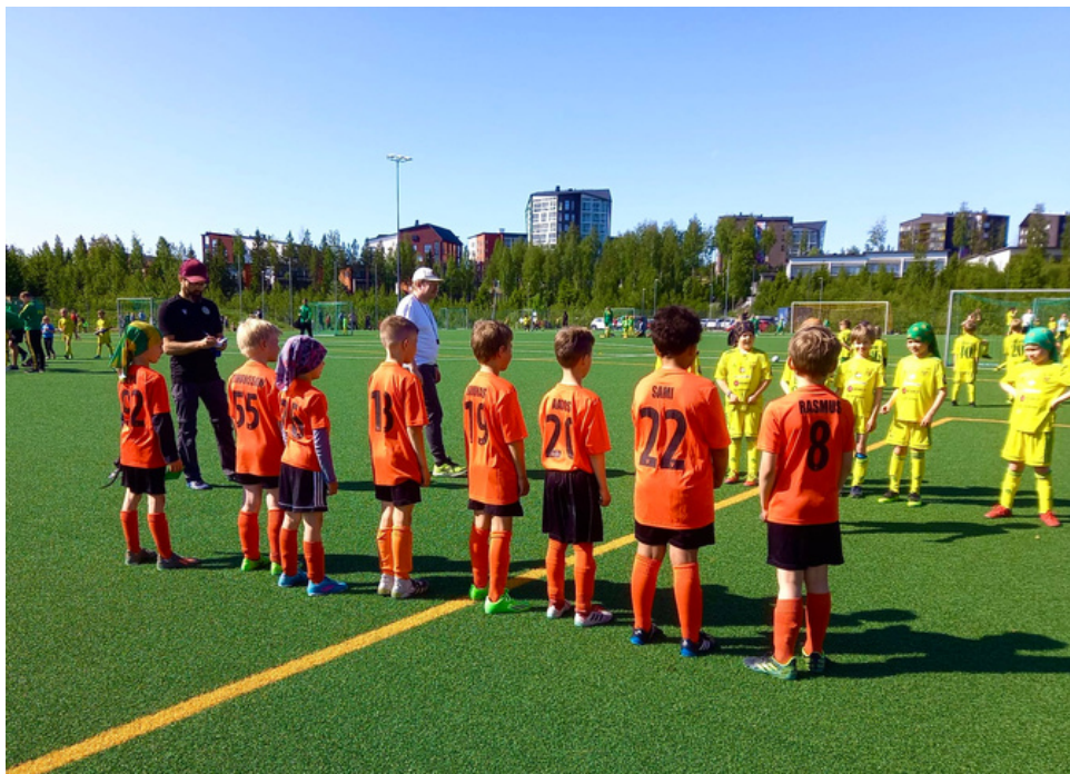
PT8/9 turnauksessa Vuoreksessa 10.6.2023

Oma nuoruusvuosieni kiekkovalmentaja on sittemmin valmentanut molemmissa joukkueissa, olen vähän sen mukaan kannustellut näitä. Ruoaksi valikoituu pelin jälkeen pitsa ananaksella!