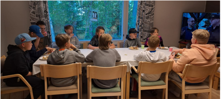
Joukkue saunaillassa Mäyriässä.

LOISKE 76 VUOTTA HTTPS://LOISKE.SPORTTISAITTI.COM