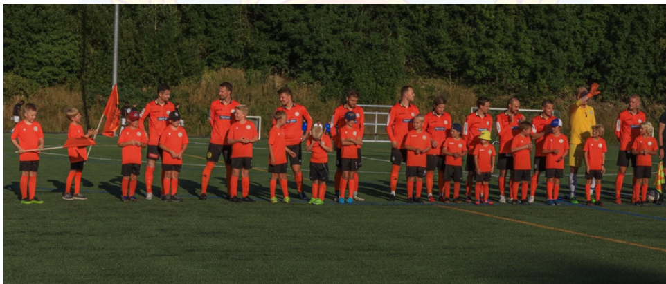
Loiske 75 vuotta -juhlaottelukuva 16.8.2022. Ottelussa vastassa FC Haka.

LOISKE 76 VUOTTA HTTPS://LOISKE.SPORTTISAITTI.COM