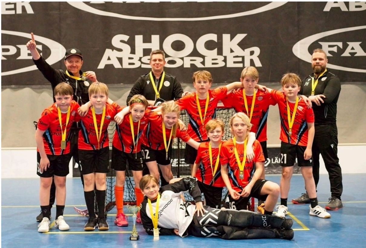
Kuva: TFT-Turnauksen voitto!