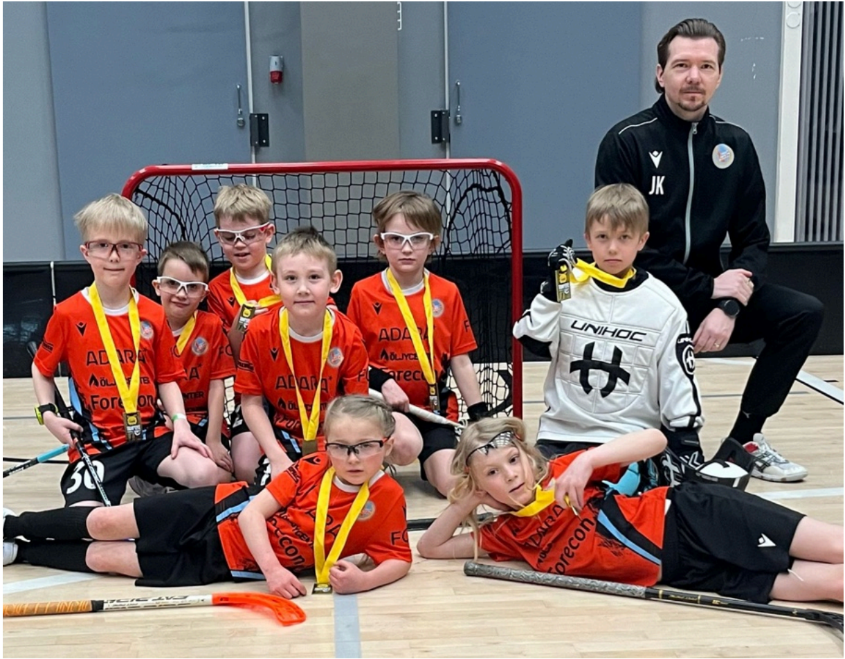
Kuva menestyksekkäästä TFT-turnauksesta huhtikuulta.