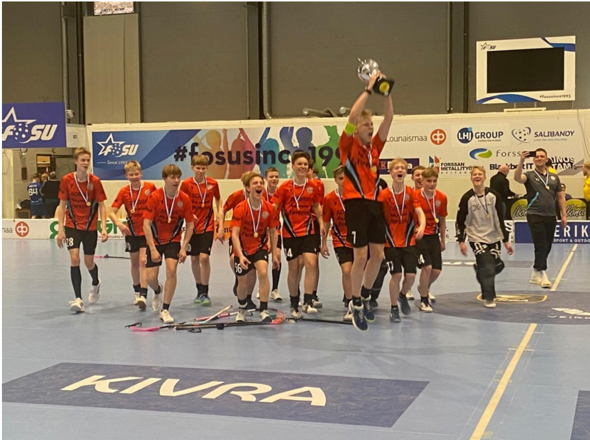
Voittotunnelmia kauden 2024-2025 loppuhuipentumasta.