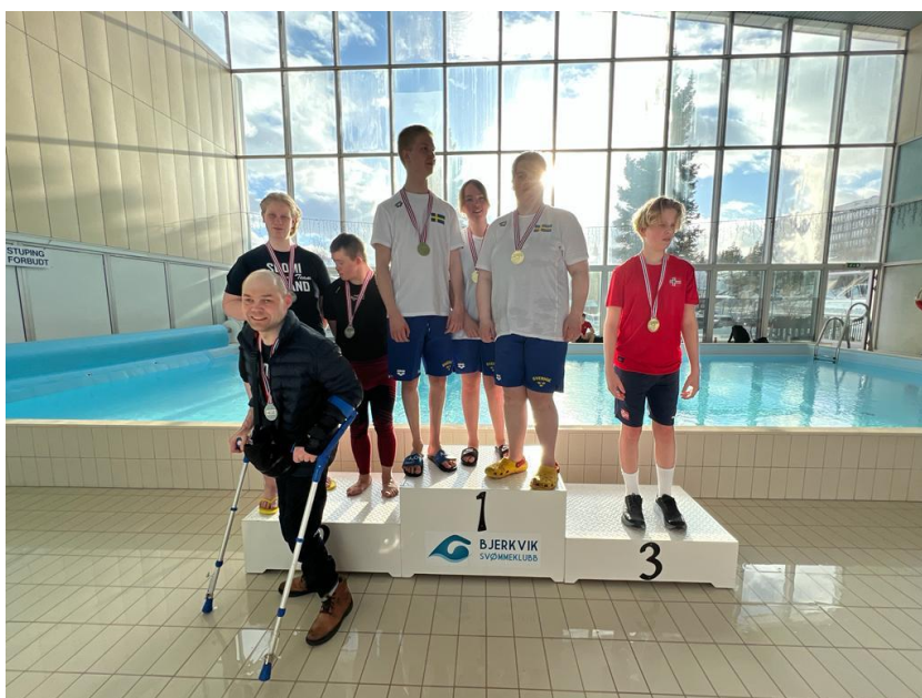
Kuva: Parauimareiden palkintojenjako Barentsin Talvikisoissa Norjan Narvikissa 2023.

Lapin Liikunnan tehtävänä on koordinoida Lapin alueen Avoimet ovet verkostoa. Vuonna 2023 Lapin Liikunta järjesti yhdessä Paralympiakomitean kanssa kaksi alueellista verkostotilaisuutta. Tilaisuudet pidettiin etäyhteyksin tai hybridinä ja niihin kutsuttiin paikallisia urheiluseuroja, lajiliittojen seurakehittäjiä ja Paralympiakomitean edustajia. Vuoden 2023 aikana nostimme esille tiedotuskanavissamme paikallista paraurheilua (Barents Urheilun ja Lapin Special Olympics urheilijoiden menestys) ja tarjosimme neuropsykiatrisen nuoren huomioiminen harrastus- ja urheilutoiminnassa koulutuskokonaisuuden. Koulutuksen kohderyhmänä olivat urheiluseurojen valmentajat ja kuntien erityisliikunnanohjaajat. Seurakehittäjä aloitti vuoden kestävän parakouluttajakoulutuksen , jonka tarkoituksena on lisätä kouluttajaosaamista soveltavan liikunnan osalta.