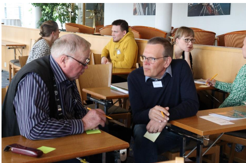
”No, mitäs me tällä kurssilla haluaisimme tehdä?”