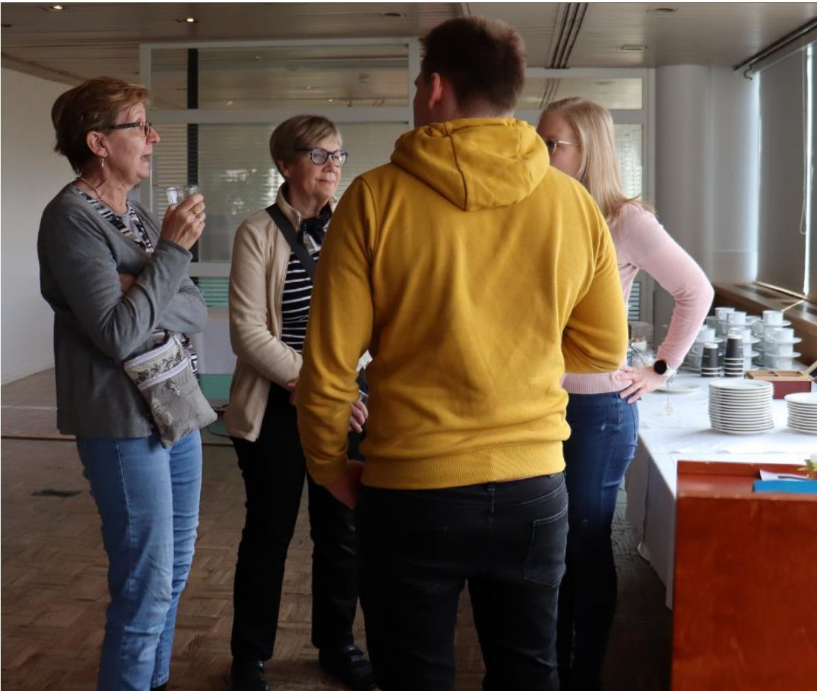
Kuulumisten vaihtoa Ruissalon Tietoa ja vertaistukea -kurssilla.