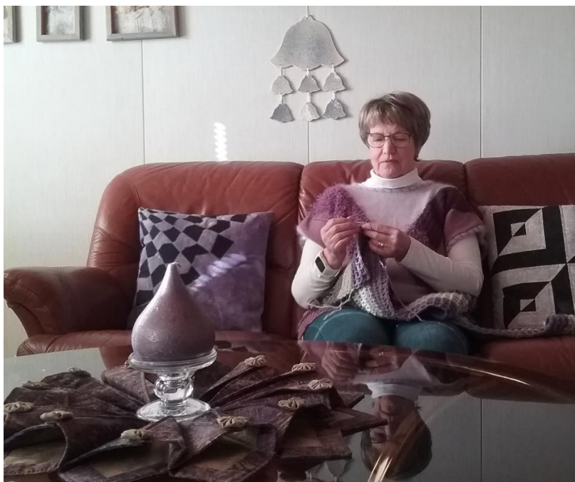
Aila Skyttelle neulominen on helppoa huvia.