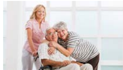
VOIMIA JA ENERGIAA VAPAISTA