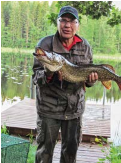
Ei ole suurempaa kateutta kuin toisen kalamiehen saalis.

V uosi on taas pian vaihtumassa ja on aika kirjata mitä on syksystä tallella. Alkajaisiksi tietenkin on se pakollinen kalajuttu. Kesän vaihtuessa lähemmäksi syksyä sain kirjattua sen ennätyshauen. 7 kg oli tarkka punnitustulos. Olihan se raukka veneeseen nostettava kun siimanpäähän tarttui. Kelpaa sitä kuva-