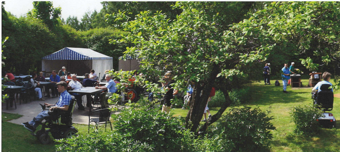
Aurinkoinen ilma houkutteli pikkuhiljaa paikalle runsaasti väkeä.

Perinteinen pihatapahtuma järjestettiin toukokuun lopulla Markkulan piha-alueella ja paikalla oli runsaasti vierailijoita sekä omasta että Etelä-Suomen alueen muista yhdistyksistä Siiven-tapahtuman tiimoilta. Edellisvuodesta poiketen päivä oli kesäisen lämmin ja aurinkoinen, joten monipuolisista toiminnoista ja esityksistä päästiin nauttimaan erityisen iloisissa tunnelmissa. Kiitokset kaikille kävijöille ja työmyyriille osallistumisesta!