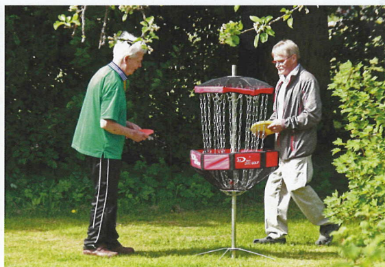
Vierailijat saivat nauttia valmiista ohjelmasta tai osallistua itse pelipisteillä tai kääpiöautoajelulla.