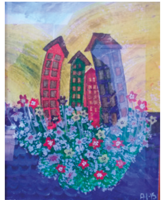
Katsojien suosikki, tekijä Arja Herttuainen